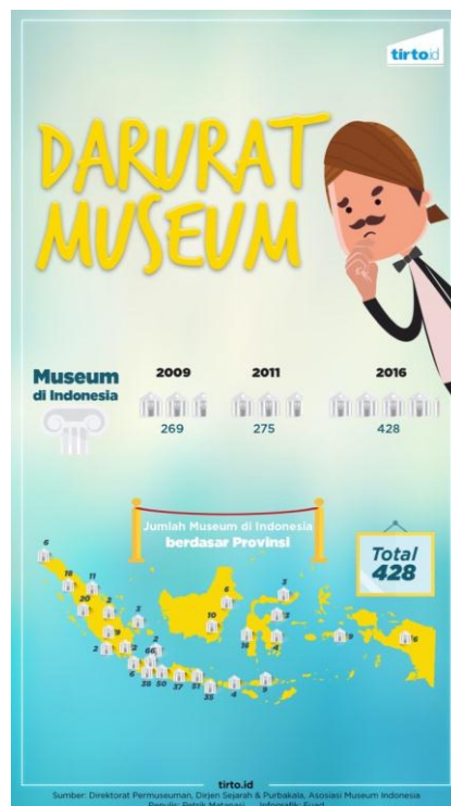
Gambar.1 Darurat Museum di Indonesia

Sebagai gambaran, secara jumlah, museum di Indonesia masih belum sebanding jumlah penduduk yang sekitar 250 juta jiwa. Menurut data Asosiasi Museum Indonesia (AMI), Indonesia saat ini memiliki 428 museum dikutip dari ( http://asosiasimuseumindonesia.org/anggota.html ). Bandingkan misalnia, dengan Amerika Serikat yang penduduknya berjumlah 320 juta jiwa, jumlah museumnya mencapai 35 ribu.