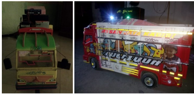
Gambar 2. Miniatur Truk Produk desa Slumbung

Sejauh ini keluhan masyarakat terutama pengrajin tebu giling di desa Slumbung adalah dalam hal pemasaran gula merah. Destinasi parade miniatur di desa Slumbung seakan dapat menjadi angin segar pemasaran usaha gula merah. Pengusaha gula merah tidak perlu repot-repot mencari pembeli atau pasokan namun justru pembeli datang sendiri di sana. Para wisatawan dapat membawa oleh-oleh berupa gula merah dengan harga yang lebih murah tentunya dibandingkan dengan harga gula merah di tempat lain.