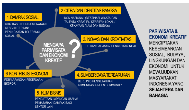
Gambar 2. Dampak Pariwisata dan Ekonomi Kreatif terhadap Pembangunan Ekonomi

Dalam mewujudkan kesejahteraan masyarakat sebagai buah dari usaha ekonomi nasional yang mandiri, maka mengembangkan industri pariwisata beserta industri kreatifnya merupakan suatu keharusan di masa sekarang. Pengembangan industri ini sangat dimungkinkan mengingat begitu kayanya Indonesia dengan banyaknya ragam pesona, mulai dari alam, sejarah, hingga budaya.