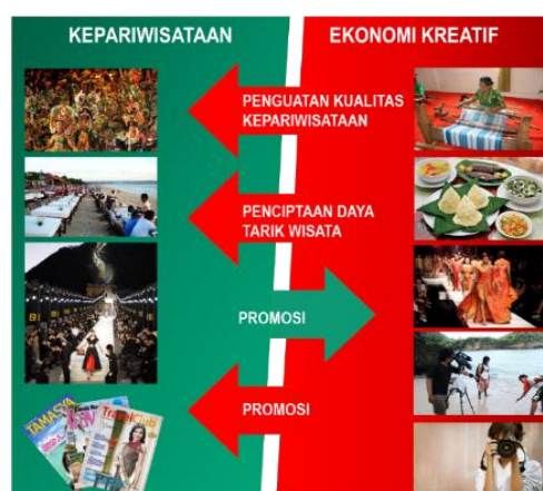
Gambar 3. Keterkaitan Antara Kepariwisataan dan Ekonomi Kreatif

Membangun daya saing bangsa di tengah bangsa-bangsa lain yang telah lebih dulu unggul, maka jalan yang harus ditempuh adalah bagaimana memetakan persoalan-persoalan yang dihadapi bangsa ini, sekaligus memilah sektor mana yang kiranya dapat menjadi pendongkrak keunggulan bangsa ini, sehingga punya posisi tawar, bisa sejajar, bahkan bila mungkin, selangkah lebih maju dari bangsa lain. Tentu bagi orang pariwisata, sektor itu adalah pariwisata karena mampu menjalin kedekatan, bahkan meningkatkan kinerja di bidang ekonomi dan bidang-bidang lain yang strategis, sehingga apa yang menjadi cita-cita kemerdekaan hidup yang aman, damai, adil, dan sejahtera bagi seluruh rakyat Indonesia dapat terealisasi. Di sini pariwisata dapat dijadikan media untuk menempatkan rakyat sebagai manusia yang memiliki potensi, harkat, dan martabat.