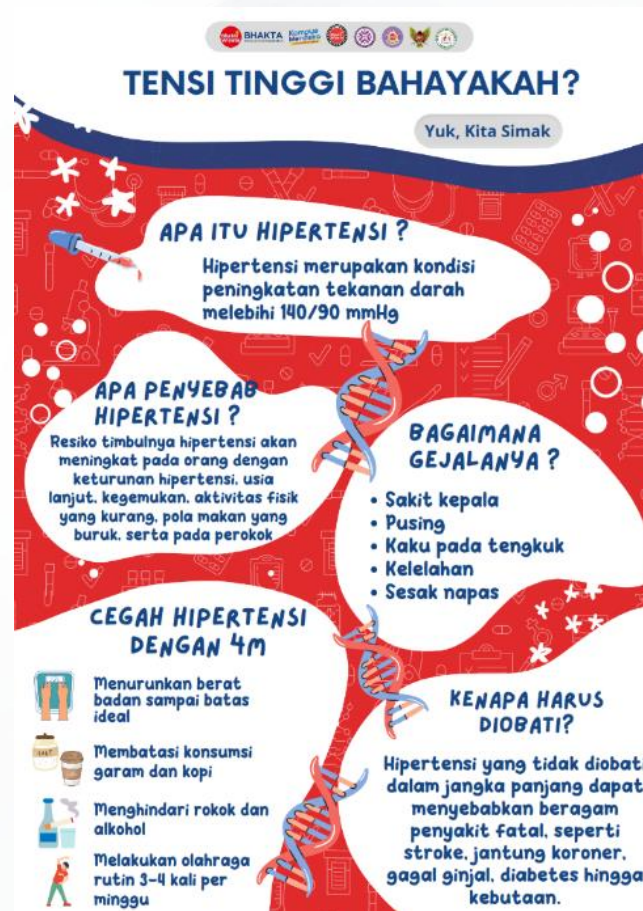
Gambar 3. Poster Pencegahan Hipertensi

Berdasarkan hasil pretest dan posttest kegiatan EHSENSORI didapatkan adanya peningkatan pengetahuan sasaran sebagai berikut: