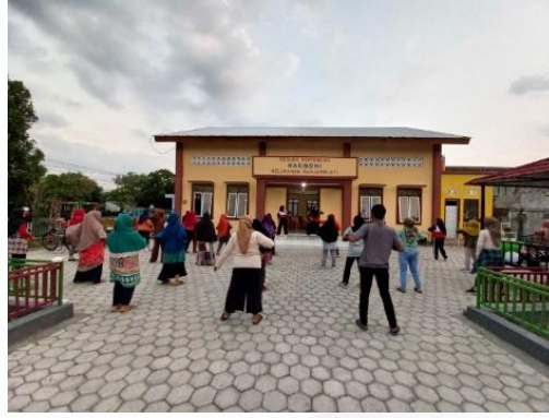
Gambar 2. Senam Sehat Sore Hari

"Inovasi Pemberdayaan Masyarakat Menuju Masyarakat Maju dan Sehat di Wilayah Pesisir, Perkebunan, dan Pertanian"