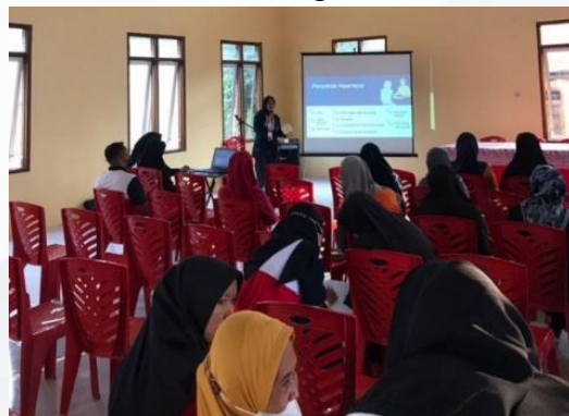
Gambar 1. Edukasi Pencegahan Hipertensi

Kegiatan EHSENSORI dilaksanakan di Gedung Harmoni Kelurahan Banjarmlati Kota Kediri dan dihadiri oleh 30 orang sasaran sebagai sasaran kegiatan yakni warga Kelurahan Banjarmlati. Sebelum Edukasi Pencegahan Hipertensi diberikan, sasaran terlebih dahulu mengisi kuesioner pretest . Edukasi ini dilaksanakan dengan metode ceramah dengan media poster dan powerpoint. Materi yang diberikan meliputi pengertian Hipertensi, penyebab Hipertensi, gejala Hipertensi, pencegahan Hipertensi dan pentingnya pengobatan Hipertensi. Setelah edukasi diberikan, sasaran mengisi kuesioner posttest . Setelah pengisian posttest , selanjutnya dilaksanakan Senam Sehat Sore Hari di halaman Gedung Harmoni Kelurahan Banjarmlati. Evaluasi Senam Sehat Sore Hari dilakukan dengan melakukan observasi antusiasme sasaran. Selama senam, sasaran sangat antusias mengikuti gerakan senam dan memberikan saran untuk bisa melaksanakan kegiatan EHSENSORI Kembali. Adapun dokumentasi kegiatan EHSENSORI adalah sebagai berikut: