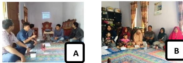
Gambar1. Pengarahan atau sosialisasi perancangan dan penerapan mini landscape melalui edukasi stek bunga mawar (A), Peserta atau masyarakat yang mengikuti sosialisasi di desa karangpring (B).

Bunga mawar mempunyai nilai ekonomi yang penting oleh karena itu penduduk Desa Karangpring perlu pembimbingan perancangan dan penerapan mini landscape melalui edukasi stek bunga mawar. Desa Karangpring yang pernah menjadi sentra mawar diharapkan tidak hanya tinggal kenangan. Pada saat ini komoditas mawar di desa tersebut hanya tersisa sebagian saja. Pada saat dilakukan kegiatan penyuluhan, ada peserta yang menyatakan ketertarikan untuk budidaya mawar, namun perlu bimbingan dalam hal pascapanen dan pemasaran produk. Hal tersebut menjadi tantangan bagi tim kami dalam kegiatan lebih lanjut.