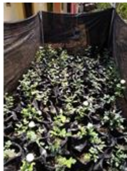
Gambar 4. Bibit mawar hasil Stek

Pertumbuhan stek dipengaruhi oleh interaksi faktor dalam dan faktor lingkungan. Faktor dalam terutama meliputi kandungan cadangan makanan dalam jaringan stek, ketersediaan air, umur tanaman (pohon induk), hormon endogen dalam jaringan stek, dan jenis tanaman. Faktor lingkungan yang mempengaruhi keberhasilan penyetekan, antara lain: media perakaran, kelembaban, suhu, intensitas cahaya dan teknik penyetekan. Media perakaran stek yang digunakan sebaiknya memiliki aerasi dan drainase yang baik serta ketersediaan air yang cukup. Ketersediaan cadangan makanan dan zat pengatur tumbuh pada bahan stek merupakan faktor yang mempengaruhi keberhasilan stek.