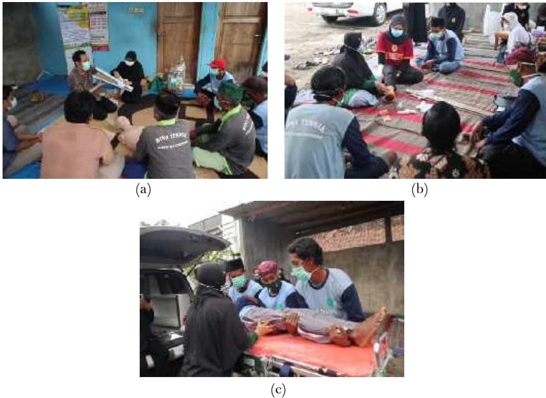
Gambar 3. (a) simulasi balut bidai; (b) simulasi bebat tekan; (c) simulasi transportasi korban ke ambulance

Pada gambar 2 simulasi tatalaksana luka trauma meliputi pertolongan awal luka lecet/tergores dan balut bidai. Penanganan awal luka lecet/tergores dapat dilakukan dengan membersihkan luka dengan air bersih lalu dikeringkan dengan kassa steril. Bila ada kotoran yang masih menempel pada luka sebaiknya di angkat menggunakan kassa steril. Bila terdapat darah yang banyak, dapat dihentikan dengan bebat tekan dengan menggunakan balut. Oleskan Antibiotik atau antiseptik pada area yang terkena luka (14). Balut bidai adalah tindakan memfiksasi/ mengimobilisasi bagian tubuh yang mengalami cedera dengan menggunakan benda yang bersifat kaku maupun fleksibel sebagai fiksator / imobilisator. Balut bidai adalah pertolongan pertama dengan pengembalian anggota tubuh yang dirasakan cukup nyaman dan pengiriman korban tanpa gangguan dan rasa nyeri (13). Simulasi dilanjutkan dengan melakukan manajemen transportasi korban ke ambulance.