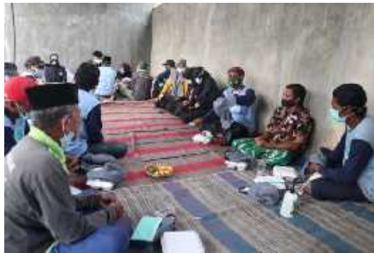
Gambar 2. Antusiasme masyarakat kelompok peternak dalam mengikuti kegiatan pengabdian masyarakat.

Kegiatan pengabdian masyarakat melibatkan peternak di desa klanting yang dilakukan dalam upaya mencegah terjadinya trauma yang dapat terjadi. kegiatan pengabdian masyarakat menggunakan metode pendekatan Population Centered Health Nursing Care yang berisi edukasi dan simulasi pencegahan dan penatalaksanaan trauma. Masyarakat yang mengikuti kegiatan pengabdian masyarakat terkait pencegahan dan penatalaksanaan trauma pada kelompok peternak di desa klanting antusias dalam mengikuti kegiatan ini, hal tersebut dapat dilihat pada gambar 2 dibawah ini,