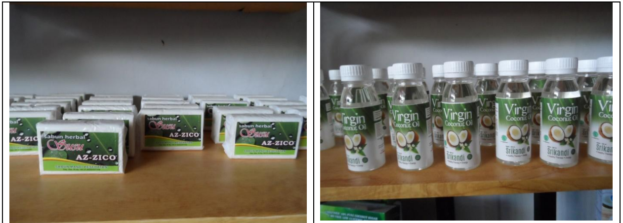
Gambar 3. Sabun Susu Kelapa dan Virgin Coconut Oil (VCO)

Srikandi bekerja sama dengan tenaga ahli dari Korea Selatan. Berikut ini adalah produk kelapa yang diproduksi oleh Koperasi Srikandi, Kabupaten Purworejo (Gambar 3 dan 4).