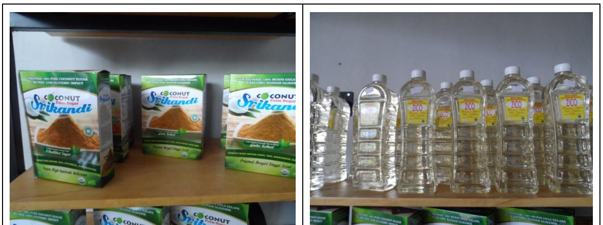
Gambar 4. Gula Kristal dan Minyak Kelapa

Minyak kelapa dan VCO mempunyai banyak khasiat untuk kesehatan, yaitu mengurangi resiko penyakit jantung dan stroke (Fife, 2018). Hal ini menjadikan produk kelapa mempunyai prospek yang cukup bagus di pasar. Dengan adanya koperasi, petani kelapa di kabupaten Purworejo dapat meningkatkan pendapatan dan kesejahteraannya, sesuai dengan manfaat koperasi yang dikemukakan oleh Sri (2005). Bahkan koperasi Srikandi tumbuh berkembang dengan sangat baik, menyerap banyak tenaga kerja dengan manajemen yang sangat professional. Pemasaran secara online tidak hanya melalui website koperasi sendiri, tetapi juga melalui online marketplace seperti Bukalapak, Tokopedia, Lazada dan lain-lain.