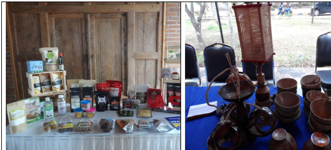
Gambar 2. Aneka Produk Kelapa

Komoditas kelapa masih banyak dijual dalam bentuk primer yang belum diolah, sehingga harga jualnya rendah. Kelapa dapat diolah menjadi berbagai macam produk, termasuk tempurung buah kelapa (Gambar 2). Menurut Niral dan Ranjini (2018), kelapa merupakan tumbuhan yang semua bagiannya memberikan manfaat bagi hidup manusia.