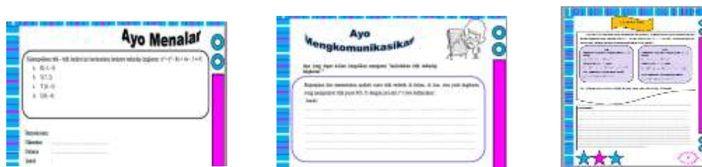
Gambar 3. Langkah Menalar, Mengkomunikasikan, dan Latihan Soal dalam LKS

pada langkah “Ayo Mencoba” ini juga memunculkan indikator-indikator kemampuan berpikir tinggi yaitu menganalisis, mengevaluasi dan mencipta.