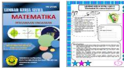
Gambar 1. Cover dan Subcover LKS