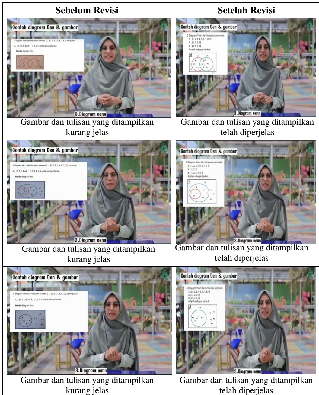
Tabel 5. Revisi Produk

Hasil validasi yang berupa saran dan kritikan dari validator selanjutnya dijadikan acuan dalam merevisi media yang telah dikembangkan. Revisi yang dilakukan peneliti dapat dilihat pada tabel 5 berikut: