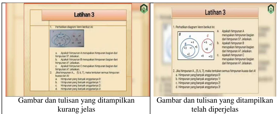
Gambar dan tulisan yang ditampilkan kurang jelas