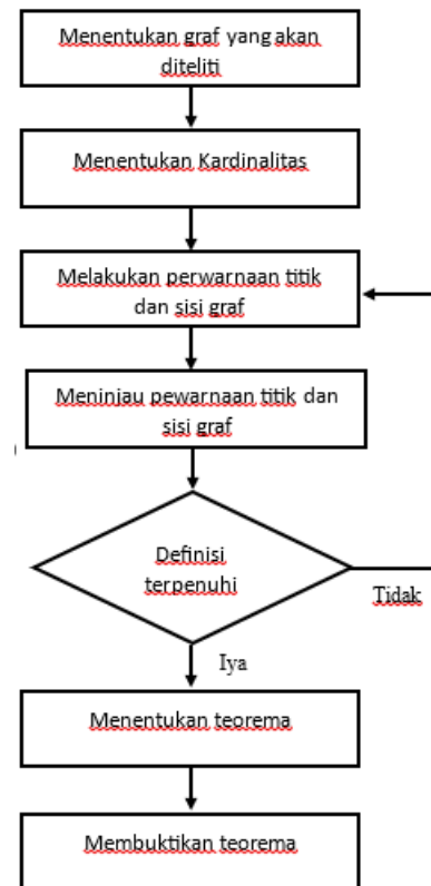
Gambar 1. Prosedur Penelitian

Metode yang digunakan dalam penelitian ini adalah metode deduktif aksiomatik dan metode pendeteksi pola ( pattern recognition ). Metode deduktif aksiomatik adalah metode penelitian yang menggunakan prinsip-prinsip pembuktian deduktif yang berlaku dalam logika matematika dengan menggunakan aksioma atau teorema yang telah ada yang dapat diterapkan dalam pewarnaan graceful pada graf siklus comb graf star . Metode pendeteksi pola ( pattern recognition ) merupakan metode untuk mencari serta menemukan pola pewarnaan dan bilangan kromatik, sehingga diperoleh bilangan kromatik graceful pada graf siklus comb graf star .