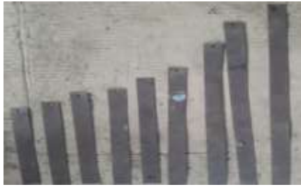
Gambar 1. Penggaris Menentukan Lebar