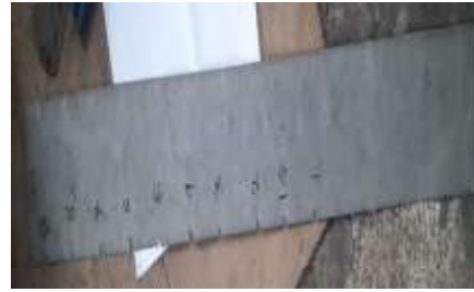
Gambar 2. Penggaris Menentukan Panjang

Aktivitas mendesain selanjutnya muncul ketika pengrajin membuat pola lubang untuk saringan dandang. Pola yang digunakan oleh pengrajin sesuai dengan bantuk saringan yaitu lingkaran dan dibuat merata lubangnya disetiap baginya agar nantinya proses pematangan nasinya juga merata. Aktivitas mendesain juga muncul ketika pengrajin membuat jaring-jaring tutup dandang yang berbentuk kerucut tanpah alas. Pembuatan lingkaran untuk jari-jari dibuat lebih besar 5 cm dari jari-jari alas dandang adalah hal pertama yang dilakukan oleh pengrajin. Hal selanjutnya membuat lingkaran kedua yang jari-jari yang sama dengan titik pusatnya terletak disebelah lingkaran pertama sehingga kedua lingkaran berpotongan. Desain pembuatan jaring-jaring tutup dandang seperti gambar 3 di bawah ini, dimana bagian yang diasir merupakan bagian yang nantinya dibuang.