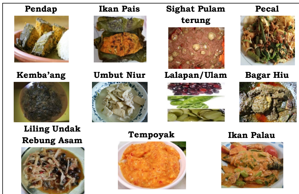
Gambar 1. Jenis-Jenis Makanan Lauk Pauk/Gulai

Makanan tradisional suku Serawai yang terkategori lauk pauk/gulai ini merupakan makanan harian yang biasa dikonsumsi masyarakat. Hal ini tercermin dalam ungkapan sehari-hari, “Tapau gulai kita saghini?” (Apa masakan kita hari ini?, atau apa lauk makan kita hari ini). Untuk makanan harian, tidak ada pola khusus dalam penyajian makanan karena dilakukan secara rutin. Menu dipilih bervariasi tiap harinya sesuai dengan kebutuhan dan keadaan keuangan.