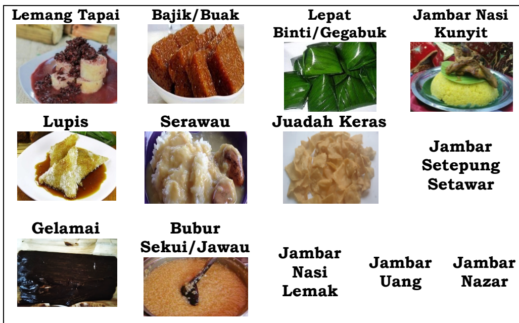
Gambar 3. Jenis-jenis Makanan Khusus

Makanan memiliki makna sebagai simbol dalam bahasa, misalnya Lemang Tapai yaitu terbuat dari beras ketan dan beras padi hitam sebagai tapainya. Sifat ketan yang lengket pada Lemang Tapai disimbolkan sebagai rasa persaudaraan yang tak terpisahkan. Dalam tradisi suku Serawai, makanan tersebut biasanya disajikan pada saat berlangsung acara pernikahan.