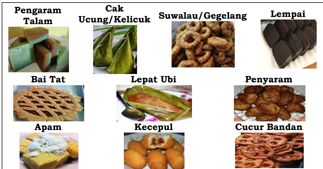
Gambar 2. Jenis-jenis Makanan Pelampun (Kue/Kudapan)

Pada umumnya, makanan ini memiliki cita rasa yang manis dan proses pembuatannya dengan cara dikukus atau digoreng. Makanan pelampun tidak hanya disajikan sebagai pengganti makan pagi sebelum beraktivitas, akan tetapi makanan ini telah mengambil peran untuk dijadikan sebagai sumber penghasilan.