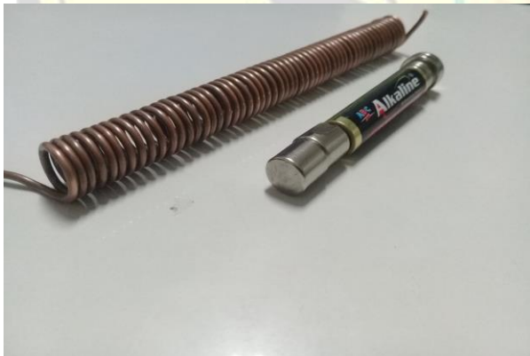
Gambar 4. Rangkaian yang lebih sederhana

Media diatas bisa dirangkai dengan mudah oleh pendidik karena bahan-bahan yang digunakan mudah untuk didapatkan. Bahan-bahan tersebut antara lain baterai, coil (kawat tembaga yang dibuat seperti pada gambar) dan neodymium super strong magnet. Prototype kereta maglev bisa disusun seperti gambar diatas, dengan kawat memanjang dan melengkung, atau seperti gambar dibawah dengan lintasan lebih pendek dan lurus.