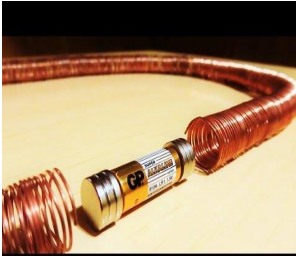
Gambar 3. Rangkaian kereta maglev

“Integrasi Pendidikan, Sains, dan Teknologi dalam Mengembangkan Budaya Ilmiah di Era Revolusi Industri 4.0 “ 17 NOVEMBER 2019