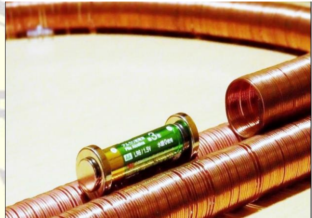
Gambar 5. Hasil pengembangan

Setelah membuat desain dan dinyatakan valid, peneliti melanjutkan penelitian ke tahap berikutnya yaitu pengembangan. Desain yang telah divalidasi kemudian dikembangkan untuk melihat kemungkinan penambahan fungsi pada media pembelajaran. Dari proses ini peneliti mengembangkan desain yang telah dibuat menjadi media yang lebih rumit. Pengembangan dapat dilihat pada gambar berikut ini: