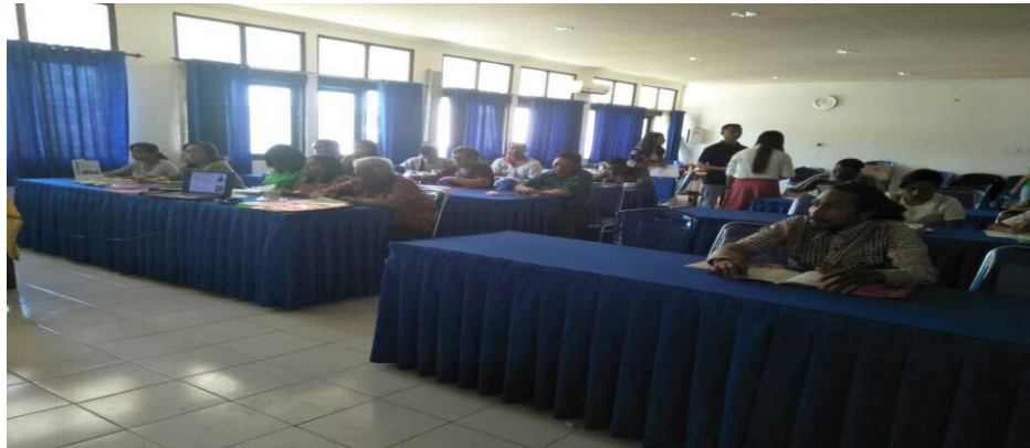
Gambar 1. Kegiatan Pelatihan pemberdayaan Majelis Gereja Untuk Pencegahan HIV dan AIDS