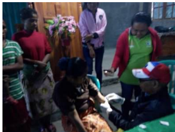
Gambar 2. Kegiatan skrining pada masyarakat yang difasilitasi oleh kelompok Majelis Gereja