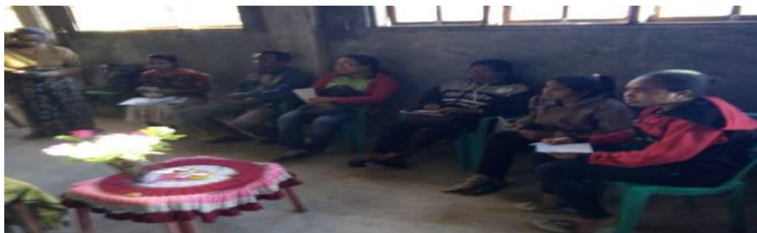
Gambar 3. Kegiatan monitoring dan evaluasi rencana aksi majelis dalam memberikan dukungan pada orang berisiko HIV