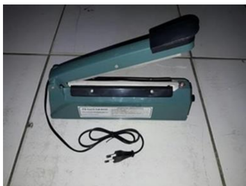
Gambar 4. Sealer Plastik

Kualitas dari kerupuk ditentukan oleh tingkat kerenyahannya. Untuk menjaga kerenyahan dan cita rasa kerupuk singkong agar dapat bertahan lama atau memiliki masa kadaluarsa yang lebih lama maka diperlukan tehnik pengemasan kerupuk yang tepat. Salah satu bahan pengemas yang sudah teruji melalui beberapa penelitian untuk menjadi bahan pengemas dari kerupuk yang mampu mempertahankan kualitas kerupuk hingga lebih dari satu tahun adalah plastik polipropilen dengan ketebalan 0,7 mm. Untuk itu, kelompok Posdaya Muslimatan Ar-Rahman akan diintroduksi sebuah sealer plastik (Gambar 4) dan bahan pengemas kerupuk yaitu plastik polipropilen dengan ketebalan 0,7 mm.