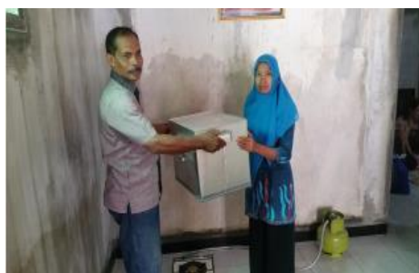
Gambar 2. Serah terima alat pengukus dan pendukung lainnya oleh ketua tim kepada ketua kelompok Posdaya Muslimatan Ar-Rahman.

Introduksi alat perebus adonan kerupuk dengan desain khusus dimaksudkan untuk mempercepat proses pematangan adonan kerupuk sekaligus mendapatkan adonan kerupuk matang dengan tingkat ketebalan yang diinginkan yaitu 2-3 mm. Alat perebus adonan kerupuk berbahan baku stainless steel dengan kapasitas 1kg per alat dengan setiap alat dapat menghasilkan 30 keping kerupuk singkong. Alat perebus adonan kerupuk dengan desain khusus dapat dilihat pada Gambar 3.