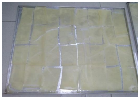
Gambar 8. Adonan Kerupuk yang baru dikeluarkan dari Alat Perebus Adonan Kerupuk

Dengan menggunakan alat ini, inovasi produk dapat dikembangkan menjadi berbagai macam bentuk krupuk yang lucu dan sesuai untuk anak-anak, yaitu membentuk krupuk dengan berbagai macam bentuk karakter kartun. Krupuk yang dihasilkan oleh mesin perebus ini memiliki kualitas yang bagus dan mampu menambah kapasitas produksi krupuk berbasis singkong.