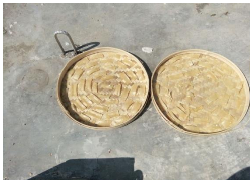
Gambar 9. Adonan Kerupuk yang sudah kering