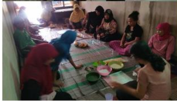
Gambar 7. Pelatihan produksi krupuk tanpa bahan pengawet pada beberapa anggota kelompok Muslimat Ar-Rahman di Dusun Krajan Barat.

Peralatan penunjang yang dihibahkan kepada kelompok yaitu alat perebus krupuk berbasis singkong dengan tenaga pembakar gas LPG. Penggunaan alat perebus ini dapat menggantikan teknologi sebelumnya yang membutuhkan waktu lama untuk menghasilkan krupuk mentah. Dalam teknologi ini tahapan yang dihilangkan yaitu proses pemotongan krupuk menggunakan pasrah. Perebus krupuk ini sangat mudah dan efisien bagi ibu-ibu karena memiliki teknologi sederhana yang tidak membutuhkan banyak prosedur dalam pengoperasiannya. Hasil uji coba peralatan perebus ini sangat baik untuk pembuatan krupuk dan sangat cepat masak.