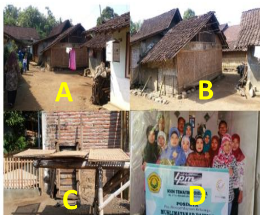
Gambar 1. A dan B. Kondisi beberapa keluarga anggota kelompok Muslimat Ar-Rahman, C. Peralatan jemur yang telah dimiliki kelompok, D. Program KKN yang telah dilaksanakan Universitas Jember dengan rangka memberdayakan masyarakat.

Kegiatan produksi krupuk yang telah berjalan saat ini masih mengalami banyak kendala, seperti: (1) kelompok posdaya masih membutuhkan pendampingan dalam upaya penguatan kelembagaan, (2) kelompok keluarga pra-sejahtera memiliki kapasitas pengetahuan yang rendah dalam bidang pengembangan usaha, (3) kurangnya keterampilan (daya inovasi dan kreatifitas) kelompok dalam memproduksi krupuk, menyebabkan produk krupuk sangat rendah (kurang dari 20 kg per hari dan tidak menarik).