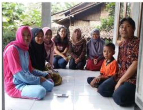
Gambar 5. Konsolidasi dan koordinasi kegiatan oleh Tim dengan Ketua Muslimatan.