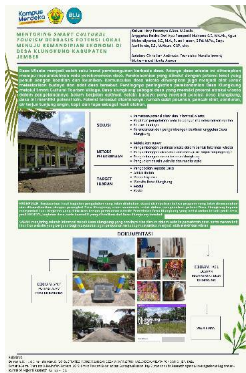
Gambar 5. Tampilan poster Desa Klungkung pada pengabdian ini.

Poster berisi ringkasan hasil penelitian dan pengabdian di Desa Klungkung, mencakup bagaimana metode pelaksanaannya, potensi apa saja yang terdapat di Desa Klungkung, solusi apa yang diberikan untuk mengatasi permasalahan yang terjadi, serta output apa yang dihasilkan untuk diberikan pada Desa Klungkung dalam mendukung smart village dan menciptakan desa mandiri.