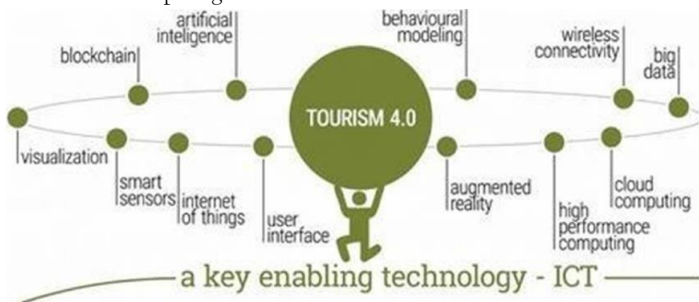
Gambar 1. Struktur Smart Tourism System .

Smart tourism menurut Gajdosik (2018) diartikan sebagai pemanfaatan segala potensi dan sumber daya untuk meningkatkan pengalaman dalam bidang pariwisata. Konsep ini lahir dari pengembangan kajian hubungan teknologi dan pariwisata agar lebih dikenal masyarakat 5 . Model yang digunakan pada riset ini adalah penciptaan smart tourism experience melalui pemanfaatan: (1) big data kepariwisataan; (2) dikelola oleh DMO pariwisata dan perusahaan teknologi; (3) terdapat permintaan wisatawan smart ; (4) didukung infrastruktur berbasis teknologi dan smart technology ; serta (5) memperhatikan digital marketing yang efisien 6 . Dengan menerapkan konsep smart tourism diharapkan akan menjamin pengembangan kawasan wisata yang berkelanjutan, terutama pada desa yang potensial, dapat diakses semua orang dengan mudah, dapat memfasilitasi interaksi pengunjung dan meningkatkan kualitas pengalaman di destinasi, serta meningkatkan kualitas hidup penduduk setempat 7 . Smart concept smart tourism diilustrasikan seperti gambar berikut.