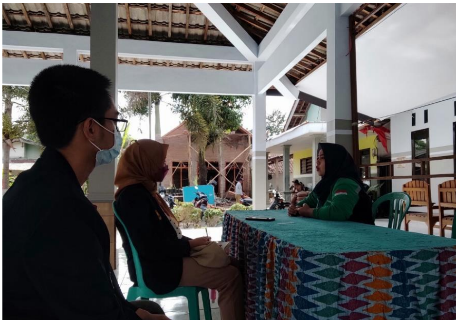
Gambar 2. Diskusi dengan perangkat Desa Klungkung tentang kondisi serta potensi yang dimiliki oleh desa.

Selanjutnya, setelah melakukan kunjungan pertama, kedua, dan ketiga yang menghasilkan asesmen berupa kategorisasi kebutuhan-kebutuhan wisata desa, kegiatan selanjutnya adalah sosialisasi smart cultural tourism bagi unsur-unsur pemerintahan desa, BUMDES, UMKM, Karang Taruna, maupun masyarakat setempat. Tim pengabdian membagikan rancangan modul dan kuesioner yang dapat digunakan untuk membantu mengidentifikasi kesiapan masyarakat desa terkait pemahaman smart cultural tourism . Misalnya, apa yang dipahami oleh UMKM dan BUMDES terkait potensi alam berupa buah durian dan lain sebagainya yang dapat dimanfaatkan untuk memajukan sektor pariwisata desa.