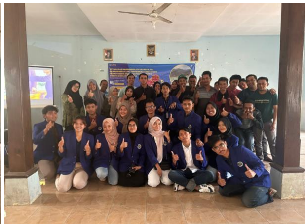
Gambar 2. Foto Bersama Tim Pelaksana dan Kelompok Tani Desa Purworejo