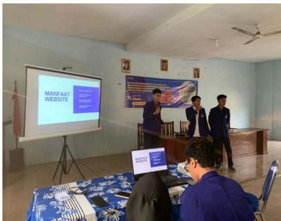
Gambar 1. Pemaparan Materi pada Kegiatan Pengabdian Masyarakat Desa Purworejo

Setelah dilakukan penyuluhan tentang digitalisasi penjualan bawang merah pasca panen di Desa Purworejo melalui promosi media sosial dan website , ditemukan bahwa kelompok tani di Desa Purworejo tertarik untuk menggunakan pemasaran digital dengan memanfaatkan media sosial dan website secara efektif untuk keberlanjutan pasca panen bawang merah di Desa Purworejo. Hal sesuai dengan pengabdian yang dilakukan oleh Rahmi (2021), bahwa dari pelaksanaan kegiatan pendampingan diketahui bahwa peserta UMKM antusias memanfaatkan media sosial untuk pemasaran digital dan memanfaatkannya secara maksimal. Pelaku usaha UMKM memandang hal ini sebagai peluang baru untuk meningkatkan kecerdikan mereka dalam mengiklankan produknya. Pemasaran digital digunakan untuk mengoptimalkan harga bawang merah pasca panen. Kelompok tani memandang ini sebagai sesuatu, atau inovasi yang bermanfaat dan dapat menginspirasi kreativitas mereka dalam promosi produk 23