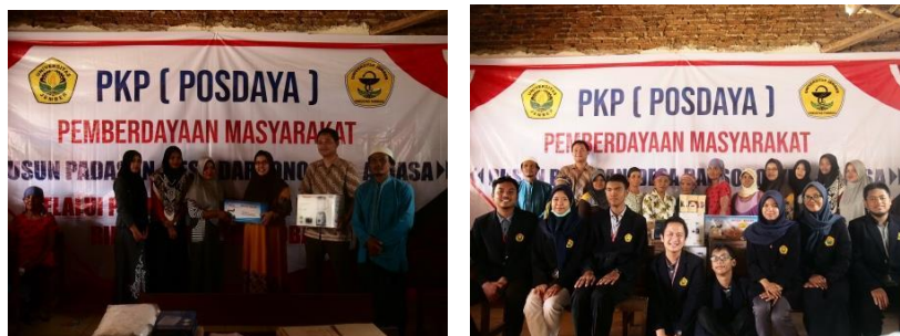
Gambar 3. Serah terima bantuan modal berupa alat kepada Posdaya Darsono

Kegiatan keempat adalah pemasaran produk yang telah dihasilkan. Mitra diberi pengetahuan mengenai cara pemasaran produk, menjalin hubungan dengan stakeholder, dan praktek pemasaran. Penyuluhan mengenai materi ini diberikan kepada pengurus Posdaya Darsono. Pada saat penyuluhan tersebut, juga dilakukan pendampingan kepada pengurus untuk membuat logo dan laman sosial media untuk publikasi kegiatan Posdaya Darsono dan pemasaran produk-produk mereka. Logo Posdaya Darsono dapat dilihat pada Gambar 4 dan laman tersebut dapat diakses pada link https://www.instagram.com/posdayadarsonosherbs/ (Gambar 5).