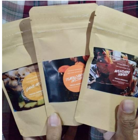
Gambar 2. Produk teh herbal Posdaya Darsono

dalam bahan tidak rusak, serta melindungi bahan dari debu dan kotoran. Oven digunakan di saat simplisia masih lembab namun tidak dapat kering lagi, misalkan karena cuaca sudah mulai mendung dan masuk musim penghujan. Sedangkan whiteboard dapat digunakan untuk kegiatan rapat dan diskusi Posdaya Darsono.