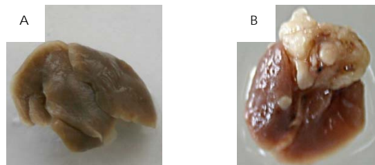
Gambar 1. Gambar makroskopik organ paru mencit betina umur 4 bulan yang telah diinduksi B[a]P secara intraperitoneal. (a) organ paru normal tidak ditemukan nodul (b) organ paru kontrol benzo[a]piren. Tanda panah menunjukkan nodul berupa massa padat berwarna putih

Pada pemeriksaan makroskopis umumnya ditemukan adanya nodul tumor yang berwarna putih keabuan, merupakan area padat, berbentuk lingkaran agak menonjol dengan diameter 0,25-1,75 mm. Penelitian secara mikroskopis dengan pengecatan hematoksillin-eosin (HE) pada nodul paru, menunjukkan adanya fokus tumor berupa massa padat dan memusat pada mencit betina yang memiliki fisiologis tumor (nodul)[6]. Penelitian ini membuktikan bahwa metode new born mice dengan senyawa karsinogen B[a]P, dapat digunakan sebagai model uji in vivo kanker paru pada mencit betina. Penelitian ini juga membuktikan bahwa mencit betina galur Balb/c sensitif terhadap agen karsinogen B[a]P dan cocok digunakan untuk metode new born mice .