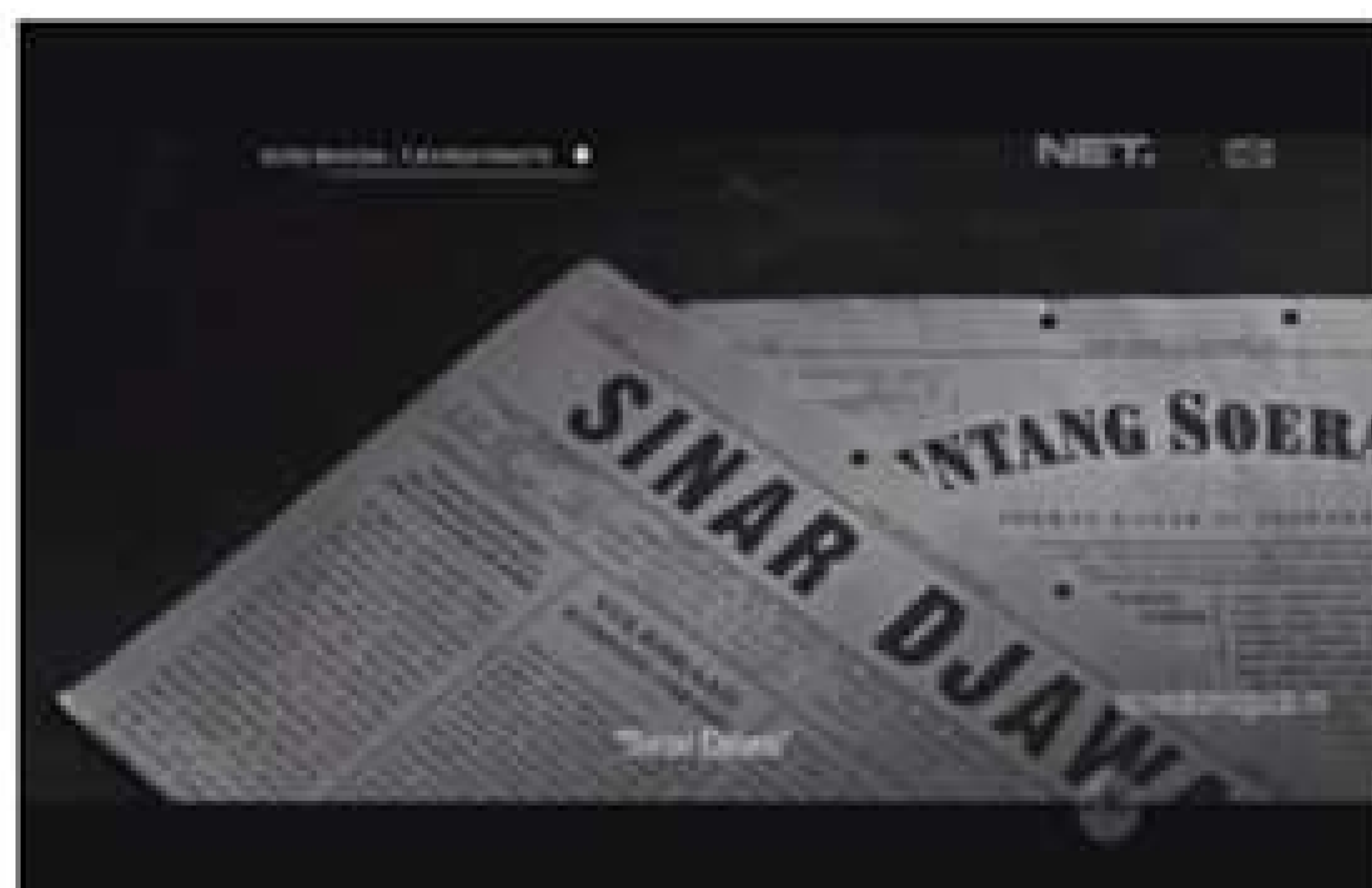
Gambar 3, tulisanTjokroaminoto yang dimuat dalam surat kabar. (00:05:26)