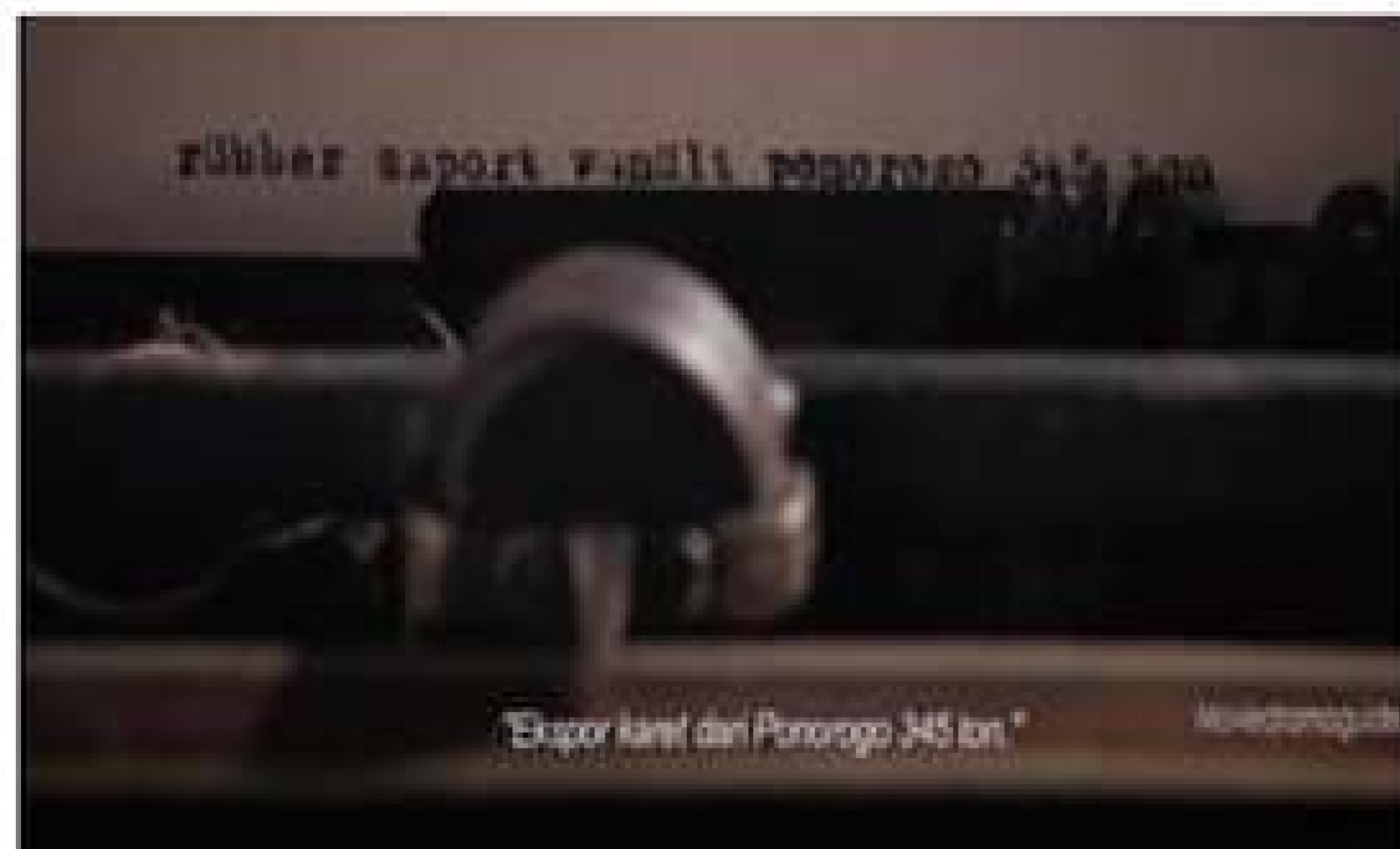
Gambar 2, tulisanTjokroaminoto tentang hasil panen pemerintah Belanda. (00:11:58)

Pembahasan terkait hal tersebut, didasarkan pada analisis " the Large Syntagmatic Category ", yakni sebuah metode untuk menemukan simbol-simbol nasionalisme dari semiotika milik Christian Metz. The Large Syntagmatic Category memiliki 8 kelompok. Namun yang digunakan dalam penelitian ini hanya dua kelompok, yaitu: autonomous shot dan episodic Sequence .