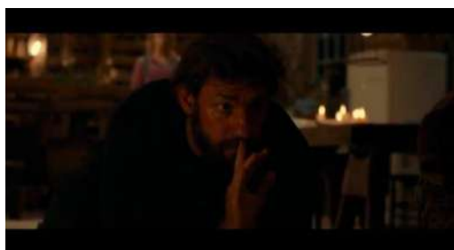
Gambar 5 Timecode 00.19.45 Medium close up menggunakan durasi gambar yang panjang

Adegan dimulai ketika Regan dan Marcus selesai makan malam dan bermain bersama di dalam rumah. Regan yang hendak bercanda dengan Marcus menyebabkan Marcus menyanggol lampu penerangan rumah hingga lampu tersebut pecah dan membuat lantai rumah mereka terbakar. Lee yang mendengar hal itu dengan sigap memadamkan api di lantai dan mencoba membuat Regan dan Marcus untuk tetap tenang. Suara lampu penerangan yang pecah tersebut membuat makhluk asing mendatangi rumah keluarga Abbott, Lee mendengarkan adanya makhluk yang berjalan di atas atap rumah dan memeriksa keluar jendela, namun yang jatuh dari atap rumahnya adalah dua ekor rakun. Nilai dramatik pada adegan ini naik setelah adegan sebelumnya memperlihatkan keluarga Abbott menjalani aktivitas seperti biasa tanpa mengeluarkan suara. Penonton kembali dibuat tegang dengan menganggap bahwa makhluk asing yang akan muncul, namun hanya dua ekor rakun.