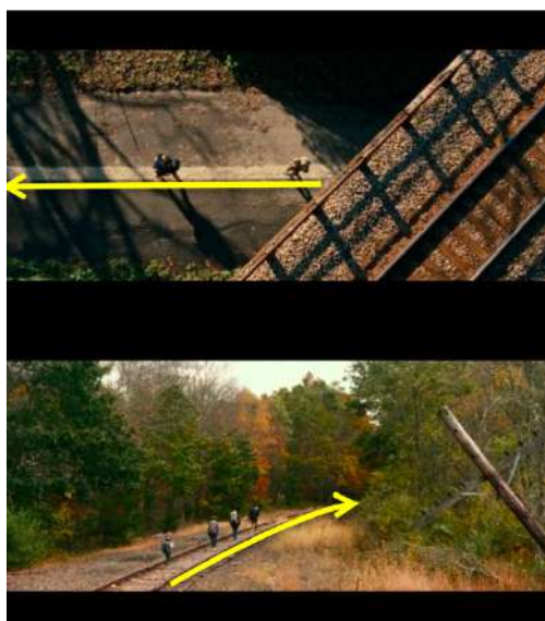
Gambar 3 Timecode 00.08.11 - 00.08.20 Long shot dengan menggunakan komposisi garis-garis

Bermula saat Beau membawa pesawat mainan dan mencoba menyalakannya hingga mengeluarkan suara nyaring pada perjalanan pulang bersama keluarga Abbott. Lee yang mendengar hal itu langsung berlari menuju Beau, namun makhluk asing terlebih dahulu menerkam Beau. Adegan ini memberikan penjelasan kepada penonton tentang keluarga Abbott yang berusaha tidak mengeluarkan suara dalam adegan ini. Penonton pun mulai ditunjukkan bagaimana makhluk asing dengan ganasnya membunuh manusia karena hanya mendengarkan suara yang dikeluarkan. Adegan ini dapat dikatakan adegan dengan nilai dramatik tension karena memberikan penonton ketegangan pada saat Beau menyalakan pesawatnya sampai dirinya terbunuh oleh makhluk asing.