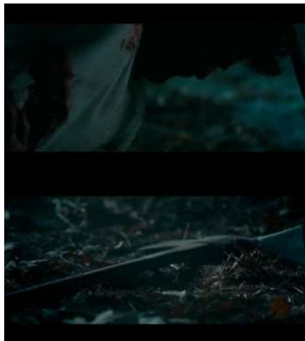
Gambar 15 Timecode 01.14.51 – 01.15.00 Medium close up dan medium shot yang digunakan secara urut bergantian

Hal ini membuat nilai dramatik tension meningkat dengan penggunaan ukuran gambar tersebut. Tracking serta durasi gambar yang pendek dan panjang secara bergantian juga membantu nilai dramatik tension .