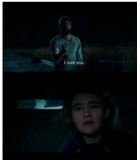
Gambar 14 Timecode 01.14.06 – 01.14.16 Low angle yang dipadukan dengan medium close up dan crane

Penggunaan low angle kembali ditampilkan dengan menampilkan kapak yang kemudian dipegang Lee dan Lee yang tetap berusaha bangkit meskipun telah diserang oleh makhluk asing. Dengan penggunaan low angle ini membuat emosi penonton ikut berada pada posisi yang sama dengan Lee untuk berjuang melindungi anak-anaknya. Medium close up dan crane juga membantu memberikan penekanan pada Lee yang berusaha bangkit. Durasi gambar yang panjang pun diberikan membuat penonton tetap fokus pada Lee dan membuat nilai dramatik naik dengan teratur.