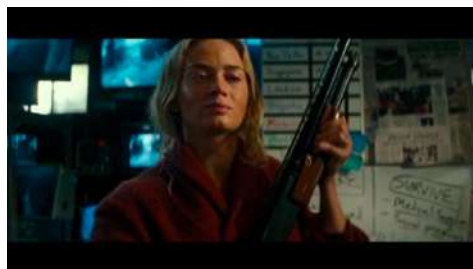
Gambar 16 Timecode 01.23.44 Evelyn yang siap membunuh makhluk asing menggunakan senjata api

7. Adegan Evelyn dan Regan bersiap untuk melawan makhluk asing yang berdatangan. pada timecode 01.18.17 – 01.23.44.