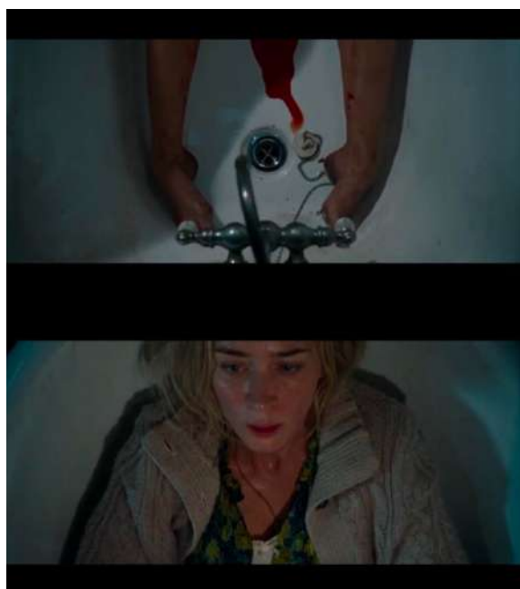
Gambar 9 Timecode 00.50.43 – 00.50.57 High angle dengan kombinasi medium close up dan tracking

Adegan dimulai ketika Evelyn yang merasa akan melahirkan segera menuju ruang bawah tanah, namun kakinya tidak sengaja menginjak paku sehingga frame foto yang dibawanya pecah. Suara pecah kaca frame menyebabkan makhluk asing datang ke dalam rumahnya. Evelyn mencoba bersembunyi dalam bathtub , Ia berusaha menahan sakit dalam perutnya yang akan melahirkan. Pada saat Evelyn berusaha menahan jeritannya ketika akan melahirkan, di sekitarnya terdapat makhluk asing yang mengintai. Di saat yang sama, Marcus menyalakan kembang api yang membuat makhluk asing itu langsung pergi ke arah suara tersebut dan saat itu juga Evelyn berteriak untuk melahirkan anaknya. Lee yang mendengar suara kembang api langsung pergi mencari Evelyn dengan membawa senjata api, ia mencari ke dalam kamar mandi dan hanya menemukan darah di dalam bathtub . Lee yang sudah mengira bahwa istrinya meninggal pun pasrah, namun Evelyn yang bersembunyi dalam kamar mandi menempelkan tangannya pada kaca sehingga membuat Lee kaget dan mengeluarkan Evelyn bersama anaknya dari kamar mandi tersebut.