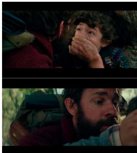
Gambar 7 Timecode 00.43.26 – 00.43.43 High angle dan low angle yang dikombinasikan dengan close up dan medium close up

High angle dan low angle dalam adegan ini digunakan sesuai dengan kegunaannya pada umumnya, high angle pada adegan ini menunjukkan bahwa Marcus benar-benar lemah dan tidak berdaya dengan ekspresinya yang tidak bisa tenang dan low angle yang menunjukkan bahwa Lee merupakan orang yang tangguh karena ia selalu tahu apa yang harus dilakukan dan juga selalu tetap tenang dalam setiap keadaan. High angle dan low angle tersebut dikombinasikan dengan close up dan medium close up sehingga membuat penekanan karakter Lee dan Marcus semakin terlihat. Hal ini menyebabkan penonton ikut merasakan terhadap keadaan Lee dan Marcus alami saat itu. Durasi gambar yang pendek memberikan efek ketegangan pada nilai dramatik yang cepat sesuai dengan perpindahan shot pada akhir adegan tersebut.