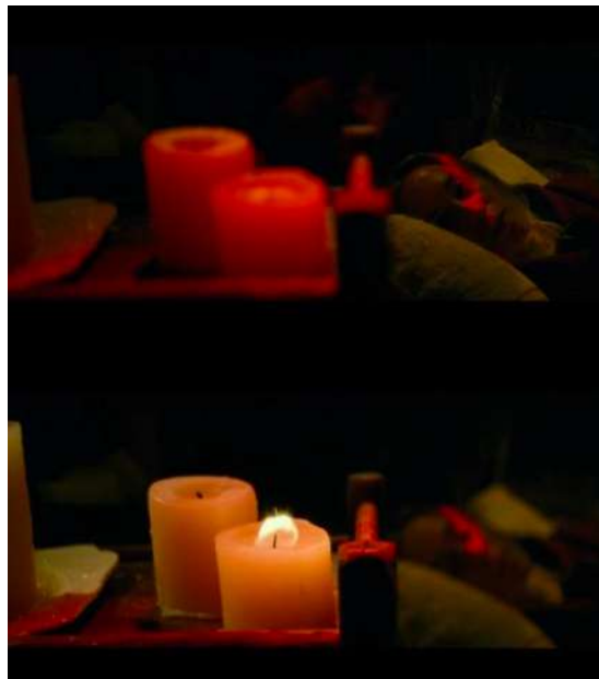
Gambar 12 Timecode 01.03.22 – 01.03.31 Durasi gambar yang panjang dengan komposisi massa-massa

Adegan bermula ketika Evelyn yang baru bangun dan menyadari saat ruangan yang dibuatnya khusus dipenuhi air setinggi lututnya, seketika itu juga ia mencari keberadaan anaknya yang berada di dekat makhluk asing. Dengan perlahan Evelyn mendekati anaknya dan mencoba mengambilnya, namun makhluk asing tersebut terus mendekatinya. Evelyn dengan membawa anaknya mencoba bersembunyi di belakang air yang terus mengalir masuk ke dalam ruangan khususnya tetapi makhluk asing itu terus mendekatinya, namun makhluk tersebut langsung pergi ketika mendengar suara Marcus yang jatuh ke lumbung.