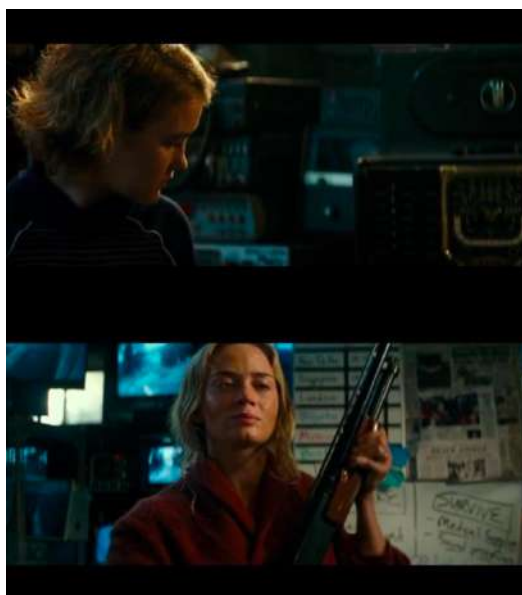
Gambar 17 Timecode 01.23.27 – 01.23.44 Medium close up dan crane pada 2 shot terakhir

kelemahan dari makhluk asing tersebut ada pada alat pendengarannya langsung menyalakan kembali menggunakan microphone didekatnya. Reaksi makhluk asing tersebut membuat Regan terus menyalakan alat pendengarannya hingga makhluk asing itu tampak mati. Regan yang melihat makhluk asing itu sudah tidak bergerak langsung mematikan alat pendengarannya, namun setelah memamatkannya makhluk asing tersebut langsung bangkit dan ingin menerkam ke arah Regan. Evelyn yang masih berada di dekat Regan pun dengan cepat menembakkan senjata apinya hingga membuat makhluk asing itu benar-benar mati hanya dengan satu kali tembakan senjatanya. Akhirnya Regan dan Evelyn lega yang berhasil membunuh satu makhluk asing itu, namun semuanya masih belum berakhir karena pada monitor banyak makhluk asing yang mendatangi rumah mereka. Evelyn dan Regan pun bersiap untuk membunuh makhluk asing yang datang tersebut.