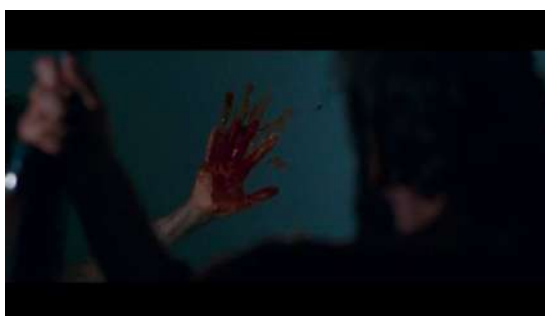
Gambar 10 Timecode 00.53.17 – 00.53.28 Komposisi massa-massa yang membuat fokus penonton berpindah

angle dalam adegan ini menunjukkan bahwa Evelyn yang terus berjuang menahan rasa sakitnya saat akan melahirkan meskipun di sekitarnya terdapat makhluk asing. Dikombinasikan dengan medium close up , perjuangan Evelyn untuk melahirkan semakin ditekankan dengan dalam adegan. Pergerakan kamera tracking pun juga menambah penekanan karakter Evelyn dalam berjuang, serta durasi gambar yang panjang juga membuat nilai dramatik semakin naik seiring dengan lamanya durasi gambar dalam adegan tersebut. Komposisi bentuk-bentuk dalam adegan ini membuat mata penonton fokus pada Evelyn dan membuat nyaman mata penonton untuk melihatnya.