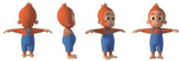
Gambar 1. Visualisasi Karakter Animasi Otan