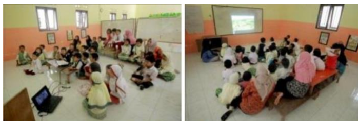
Gambar 6. Respon anak-anak

Pada saat penayangan berlangsung, peneliti melihat respon anak-anak dalam menonton program acara Si Otan. Berikut respon anak-anak pada saat menonton acara Si Otan.