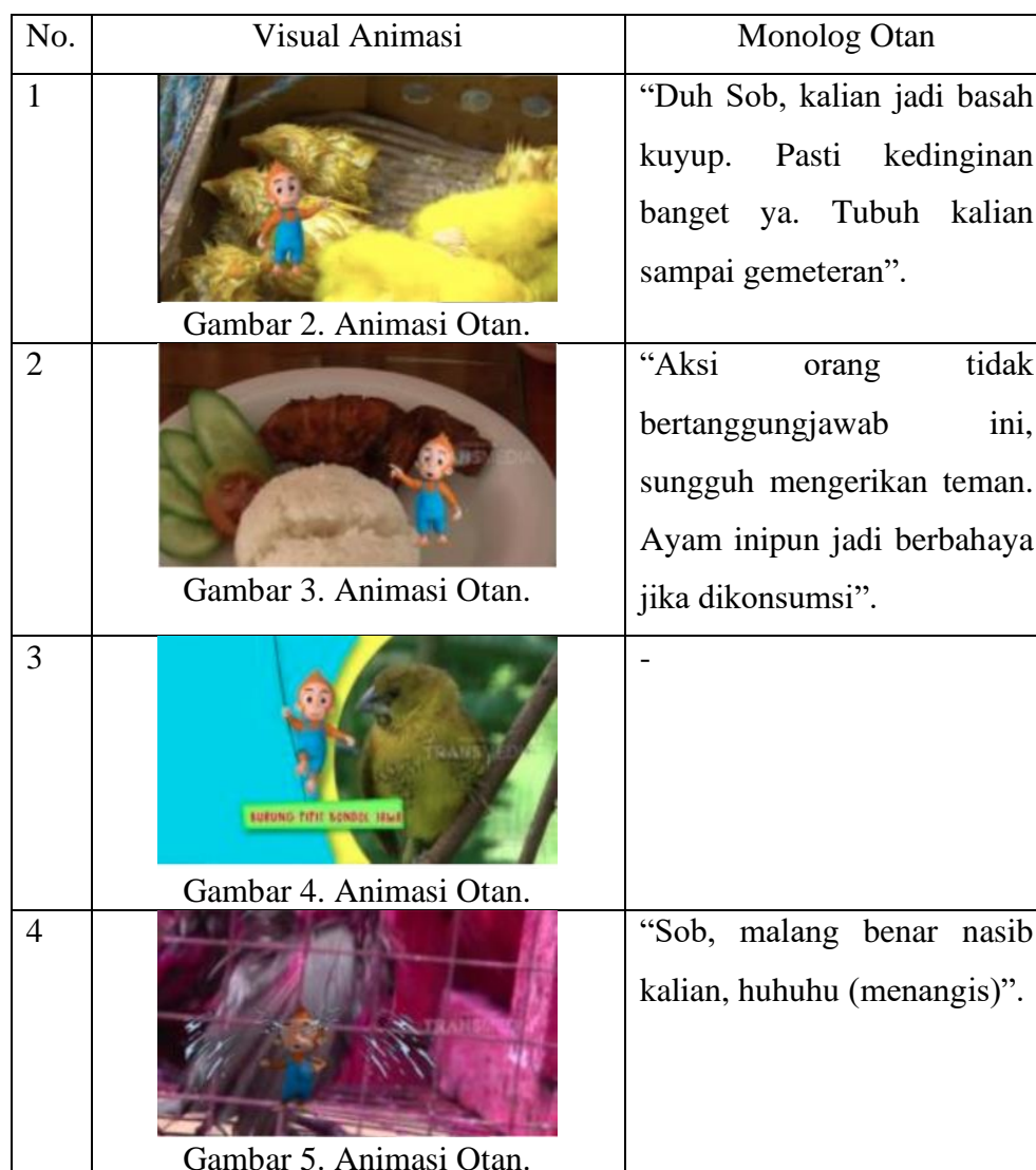
Tabel 2. Penjelasan Animasi Otan episode “Kami Di Paksa Lucu”

Pada visual tersebut, menunjukkan sosok animasi Otan yang aktif dan pintar dalam menjelaskan tiap informasi dengangaya khasnya. Pegerakan dan suara khas dari Otan tersebut, mampu menarik perhatian anak-anak untuk memperhatikan apa yang disampaikan oleh Otan dengan baik. Proses belajar menggunakan audio visual seperti menayangkan acara Si Otan, mampu melibatkan indera penglihatan dan pendengaran anak-anak untuk ikut bekerja. Informasi yang dilihat dan didengar memberikan stimulus pada otak, yang akhirnya informasi tersebut mampu diterima dan diingat oleh anak-anak. Informasi yang dijelaskan oleh Otan pada visual tersebut mengenai pewarnaan hewan agar terlihat lucu, yang di perjual belikan untuk meraup untung pribadi tanpa menghiraukan nasib dari hewan-hewan tersebut. Otan