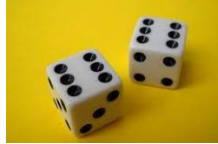
Gambar 3. Dadu

Untuk memainkan SI BEGAL TRANSPOTASI digunakan dua buah dadu yang masing-masing memiliki enam mata dadu.