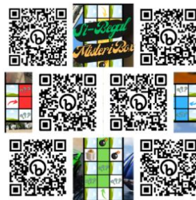
Gambar 6. Barcode Misteri Boks

Kartu ini berisi barcode dengan pemain wajib memindai, pemain akan mendapatkan sesuatu materi yang disampaikan melalui video pembelajaran.