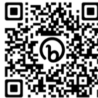
Gambar 5. Barcode Pertanyaan

Kartu Pertanyaan berisi barcode , pemain dapat memindai dan menjawab pertanyaan yang telah dipilih secara acak tentang keselamatan berlalu lintas.