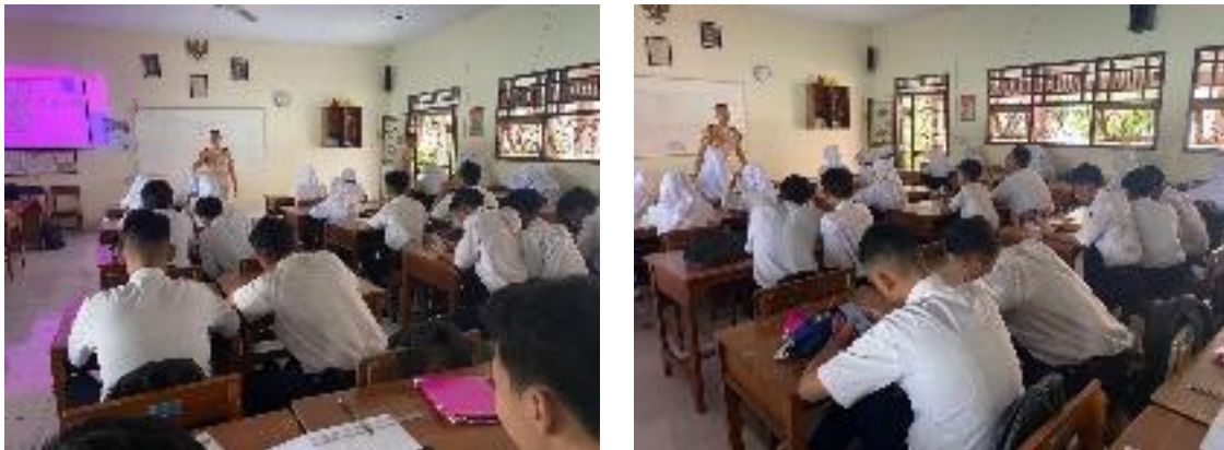
Gambar 8. Implementasi permainan SI BEGAL TRANSPORTASI pada SMPN 10 Tegal

Setelah dilakukan sosialisasi mengenai tahapan permainan serta tujuan permainan pada siswa siswi SMPN 10 Tegal maka dilakukan implementasi permainan SI BEGAL TRANSPORTASI ini dengan bantuan satu pengajar dari SMPN 10 Tegal. Gambar berikut ini merupakan dokumentasi mengenai implementasi permainan yang telah dilakukan pada siswa siswi SMPN 10 Tegal.