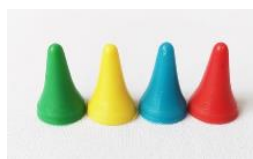
Gambar 2. Bidak-Bidak

Bidak-Bidak merupakan satu alat yang berfungsi untuk mewakili pemain. Setiap pemain memiliki bidak yang berbeda dengan yang lain. Bidak ini berbentuk gambar transportasi dari beberapa moda.