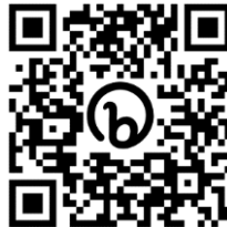
Gambar 4. Barcode Tantangan

Kartu Bom berisi barcode , pemain diwajibkan memindai dan mendapatkan sebuah tantangan acak yang wajib dilaksanakan selama permainan ini berlangsung.