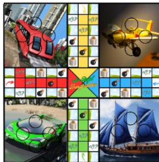
Gambar 1. Papan “SI BEGAL TRANSPOTASI”

Papan permainan yang digunakan berukuran 50 x 50 cm, berisi 72 petak yang berisi berbagai jenis transportasi, keselamatan bagi pengguna jalan, dan infrastruktur jalan.