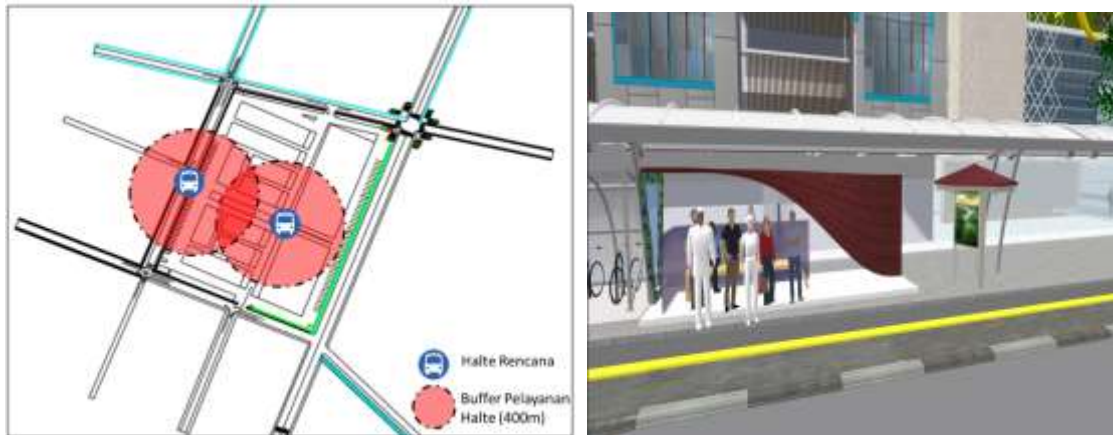
Gambar 4. Rekomendasi Titik Lokasi Halte dan Perencanaan Fasilitas Halte Pada Kawasan Pasar Sentral

fasilitas halte didasarkan pada kemauan orang berjalan kaki sejauh 400 meter (ITDP, 2017).