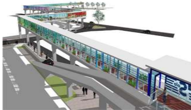
Gambar 2. Konsep perencanaan Skybridge Antar Pusat Kegiatan

Pemberian fasilitas disabilitas seperti moving block dengan warna kuning berdasarkan standar Peraturan Menteri Pekerjaan Umum Nomor : 03/Prt/M/2014 /2011 Tentang Pedoman Perencanaan, Penyediaan, Dan Pemanfaatan Prasarana Dan Sarana Jaringan Pejalan Kaki Di Kawasan Perkotaan. Perencanaan wayfinding atau pemandu arah merupakan salah satu fasilitas pendukung dalam memudahkan pengunjung khususnya yang berjalan kaki dalam memudahkan pergerakan menuju kawasan lokasi. Pemberian wayfinding atau pemandu arah menjadi penting dalam fungsinya sebagai fasilitas integrasi kawasan (ITDP Indonesia, 2019). Fasilitas eksisiting juga belum memberikan keterlindungan terhadap pejalan kaki. Keterlindungan dalam konsep keberlanjutan merupakan suatu fasilitas yang memberikan kenyamanan yang timbul dari keterlindungan terhadap cuaca maupun gangguan benda asing (ITDP, 2017; ITDP Indonesia, 2019). Perencanaan fasilitas pejalan kaki pada pasar sentral atas dan bawah berdasarkan variabel convenience dapat divisualisasikan sebagai berikut: