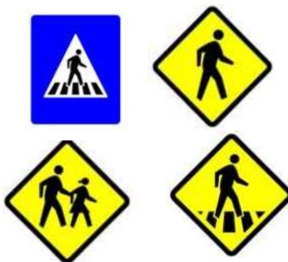
Gambar 5. Rekomendasi Rambu Pejalan Kaki Pada Kawasan Pasar Sentral

Penggunaan rambu pada sekitar kawasan pasar dilakukan guna memberikan dampak aman atau safety pada pejalan kaki. Pemilihan fasilitas penyebrangan yang sesuai dengan kebutuhan keselamatan pejalan kaki didasari pada Perencanaan Teknis Fasilitas Pejalan Kaki Kementerian Pekerjaan Umum Dan Perumahan Rakyat (2018). Rambu yang dapat digunakan pada kawasan pasar Sentral Kabupaten Sinjai guna meningkatkan aspek safety yaitu :