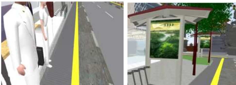
Gambar 3. Fasilitas Rekomendasi Fasilitas Pejalan Kaki Moving Block Dan Wayfinding

Pemberian fasilitas disabilitas seperti moving block dengan warna kuning berdasarkan standar Peraturan Menteri Pekerjaan Umum Nomor : 03/Prt/M/2014 /2011 Tentang Pedoman Perencanaan, Penyediaan, Dan Pemanfaatan Prasarana Dan Sarana Jaringan Pejalan Kaki Di Kawasan Perkotaan. Perencanaan wayfinding atau pemandu arah merupakan salah satu fasilitas pendukung dalam memudahkan pengunjung khususnya yang berjalan kaki dalam memudahkan pergerakan menuju kawasan lokasi. Pemberian wayfinding atau pemandu arah menjadi penting dalam fungsinya sebagai fasilitas integrasi kawasan (ITDP Indonesia, 2019). Fasilitas eksisiting juga belum memberikan keterlindungan terhadap pejalan kaki. Keterlindungan dalam konsep keberlanjutan merupakan suatu fasilitas yang memberikan kenyamanan yang timbul dari keterlindungan terhadap cuaca maupun gangguan benda asing (ITDP, 2017; ITDP Indonesia, 2019). Perencanaan fasilitas pejalan kaki pada pasar sentral atas dan bawah berdasarkan variabel convenience dapat divisualisasikan sebagai berikut: