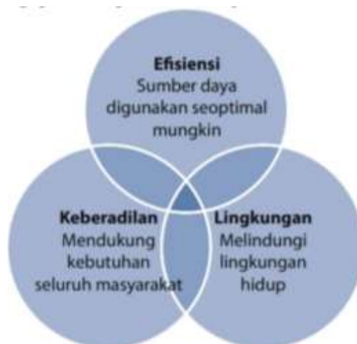
Gambar 1. Tiga Pilar Transportasi Berkelanjutan

Fasilitas transportasi dari segi pejalan kaki dan angkutan umum belum terpenuhi pada pasa sentral atas dan bawah. Perlunya peningkatan fasilitas guna memberikan kenyamanan, keterhubungan, dan keamanan bagi transportasi prioritas (pejalan kaki dan angkutan umum). Tujuan dari pemenuhan transportasi berkelanjutan melalui tiga pilar transportasi berkelanjutan yaitu, efisiensi, keberadilan, dan lingkungan (Tavassoli & Tamannaei, 2020). Efisiensi mengarah pada penggunaan sumber daya yang digunakan seoptimal mungkin. Keberadilan ditujukan pada dukungan terhadap kebutuhan seluruh masyarakat. Lingkungan ditujukan guna melindungi dan menjaga lingkungan hidup.