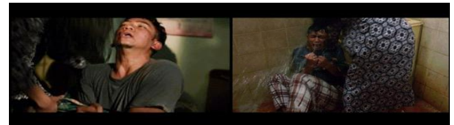
Gambar 3. Scene menunjukkan perjuangan Uje lepas dari jerat narkoba.