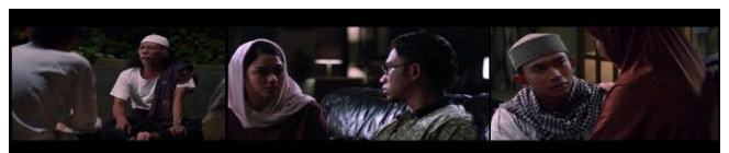
Gambar 12. Alternate syntagma menunjukkan kondisi Uje yang terus mencoba menjadi lebih baik dengan terus belajar dari orang-orang disekitarnya.