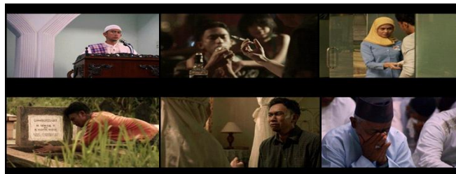
Gambar 8. Ordinary sequence menunjukkan proses Uje yang tidak mudah untuk kembali ke jalan kebaikan.