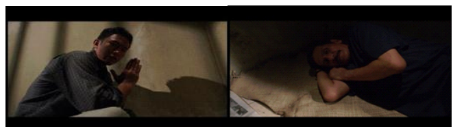
Gambar 6. Scene