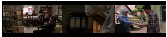
Gambar 2. Episodic sequence menunjukkan keikhlasan Pipik menerima kondisi Uje.