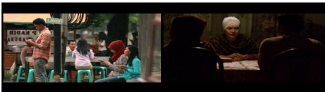
Gambar 7. Scene menunjukkan perjuangan Uje dan Pipik untuk menikah.

Rangkaian peristiwa setelah Uje bertaubat yang menunjukkan pesan pantang menyerah terdapat pada gambar 8. Pada analisis Metz gambar 8 merupakan bagian dari analisis ordinary sequence . Persepsi yang terbentuk dalam pemahaman Uje tentang pesan pantang menyerah terlihat pada pada gambar 8. Proses pemahaman tersebut termasuk dalam insight bergantung pada pengaturan secara eksperimental.