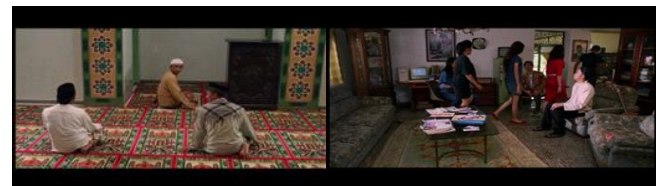
Gambar 4. Scene menunjukkan keikhlasan Uje menerima perlakuan orang-orang disekitarnya.