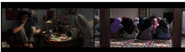
Gambar 1. Parallel syntagma yang menunjukkan kondisi Uje dan keluarga yang saling bertolak belakang.

Peristiwa setelah Uje bertaubat yang menunjukkan pesan keikhlasan terdapat pada gambar 4. Rangkaian gambar 4, dalam the large syntagmatic category juga termasuk teknik analisis scene . Persepsi terhadap pemahaman Uje tentang keikhlasan ditunjukkan gambar 4. Berdasarkan sifat insight in learning peristiwa pada gambar 4 termasuk dalam insight berdasarkan kemampuan dasar manusia.