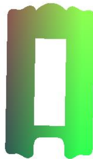
Gambar 2. Modelisasi relief atas bidding box bridge