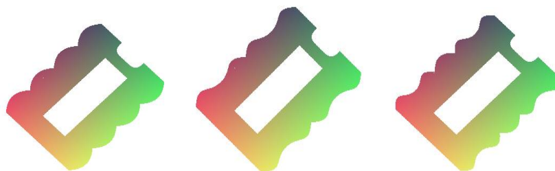
Gambar 1. Interpolasi relief bagian samping bidding box bridge sisi atas