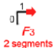
Gambar 2. Generasi pertama L -system fraktal i -Fibonacci word i=3

Penafsiran grafis i=3 dan i=5 pada fraktal i -Fibonacci Word generalisasi ganjil masing-masing dapat dilihat pada Gambar 2 dan Gambar 3.