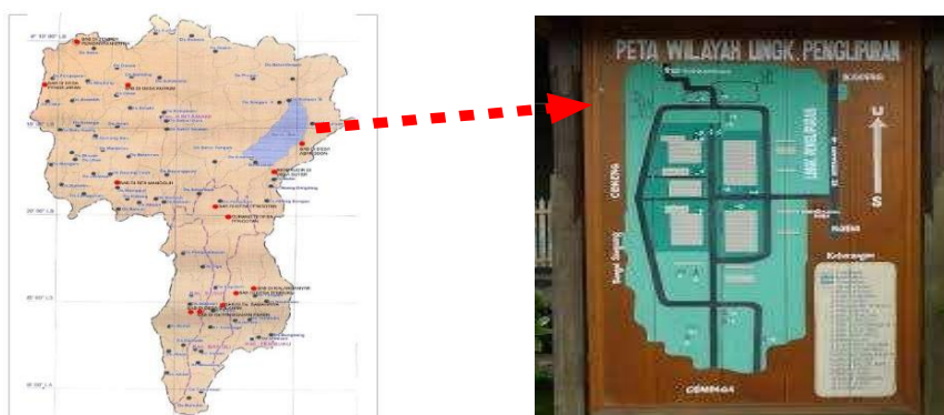
Gambar 1.1 Peta Ruang Lingkup Perencanaan

Lokasi studi dalam penelitian ini berlokasi di Desa Penglipuran yang berada di Kabupaten Bangli, Provinsi Bali. Desa Penglipuran memiliki luasan seluas 112 Ha.