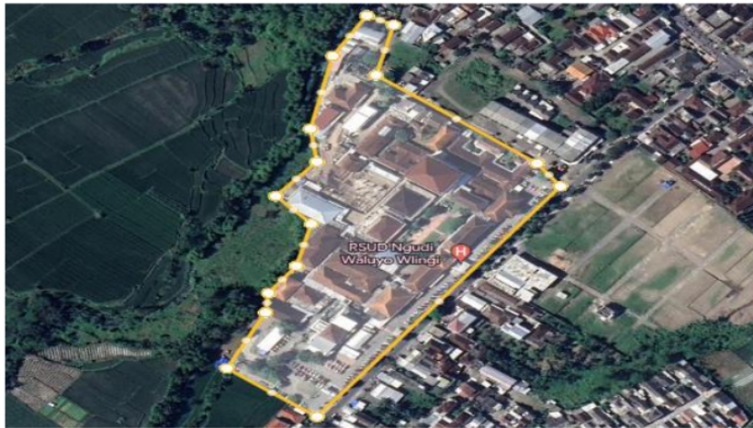
Gambar 1 Lokasi Penelitian

Berikut adalah gambaran umum dari proyek pembangunan gedung ICU RS Ngudi Waluyo Blitar :