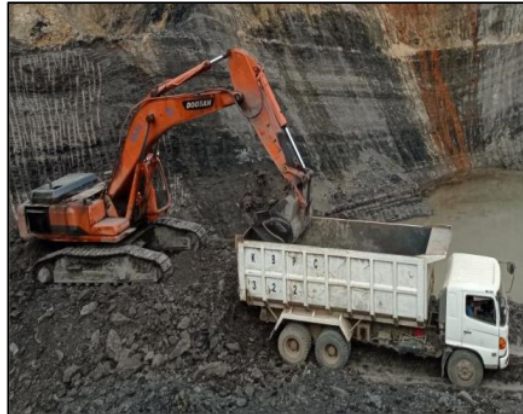
Gambar 2 Pola Pemuatan Top Loading

Pola pemuatan berdasarkan jumlah penempatan Dump Truck adalah paralel dengan penempatan tunggal truk, yang berarti Dump Truck ditempatkan untuk dimuat di depan area kerja. Dump Truck berikutnya menunggu hingga Dump Truck pertama telah dimuat penuh sebelum bergerak. Setelah Truck pertama pergi, Truck berikutnya akan ditempatkan di depan area kerja untuk dimuat, dan pola ini berlanjut seperti yang terlihat pada Gambar 3 .