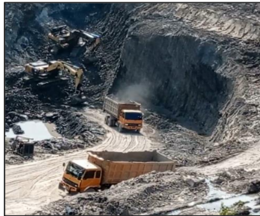
Gambar 3 Pola Pemuatan Parallel Cut with the Single Spotting of Trucks

Pola pemuatan berdasarkan jumlah penempatan Dump Truck adalah paralel dengan penempatan tunggal truk, yang berarti Dump Truck ditempatkan untuk dimuat di depan area kerja. Dump Truck berikutnya menunggu hingga Dump Truck pertama telah dimuat penuh sebelum bergerak. Setelah Truck pertama pergi, Truck berikutnya akan ditempatkan di depan area kerja untuk dimuat, dan pola ini berlanjut seperti yang terlihat pada Gambar 3 .