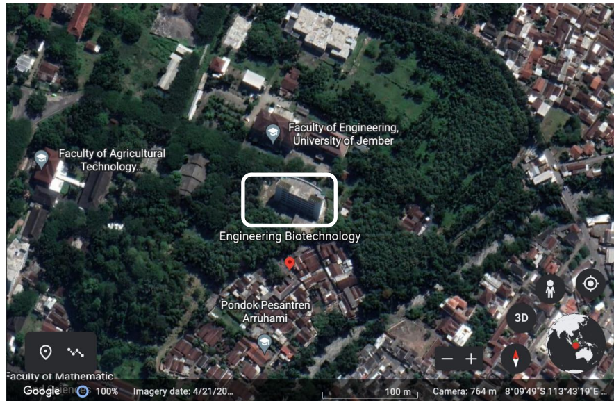
Gambar 1. Lokasi Integrated Laboratory for Engineering Biotechnology