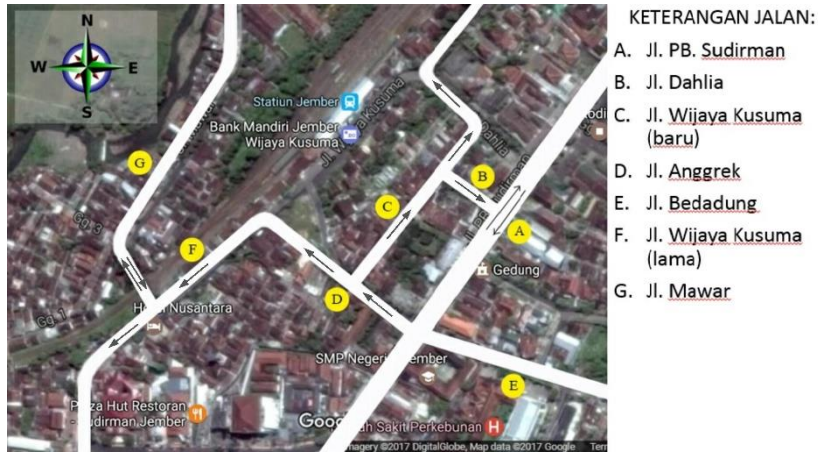
Gambar 3 Skenario ke 1 pengaturan Arus lalu lintas setelah dilakukan pengembangan