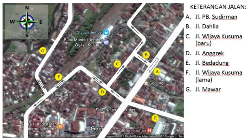
Gambar 4. Skenario 2 pengaturan Arus lalu lintas setelah dilakukan pengembangan