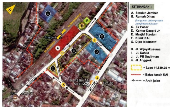
Gambar 2. Arus lalu lintas pada jaringan jalan di Stasiun Jember kondisi eksisting

Arus lalu lintas pada jaringan jalan si sekitar stasiun jember sebelum dilakukan pengembangan dapat dilihat pada gambar 2.