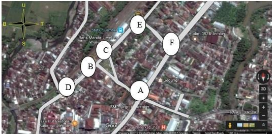
Gambar 1. jaringan jalan stasiun Jember

Pada gambar 1 yaitu jaringan jalan pada Stasiun Jember dengan keterangan sebagai berikut: