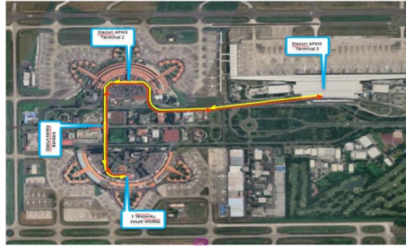
2 Gambar 1 Layout Jalur Perjalanan Kereta Automated People Mover System Bandar Udara Internasional Soekarno – Hatta

Berdasarkan gambar 1 kereta Automated People Mover System Bandar Udara Internasional Soekarno – Hatta memiliki jalur khusus yang dapat menghubungkan konektivitas penumpang di dalam kawasan internal bandara, sehingga penumpang yang ingin berpindah tempat dapat terbebas dari hambatan kemacetan lalu lintas. (Wasanta et al., 2021)