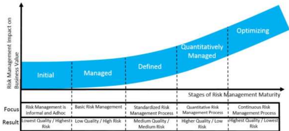
Gambar 2 Kurva risk maturity level