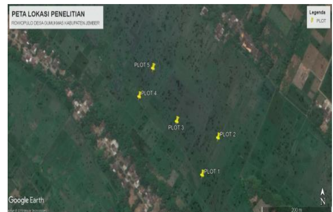
Gambar 1. Peta plot penelitian lahan Rawa di Rowopulo.

jaring ayun. Pengamatan dilaksanakan dari mulai umur 14 hari setelah tanam (hst) sampai dengan 77 hst dengan interval 7 hari. Pengamatan dilakukan pada waktu pagi dan sore hari. Teknik pengamatan dilakukan dengan menggunakan transect line yaitu dengan cara berjalan mengikuti lajur tanaman pada plot pengamatan serta menghitung jumlah serangga yang ditemukan di sepanjang jalur pengamatan (Bismark 2011).