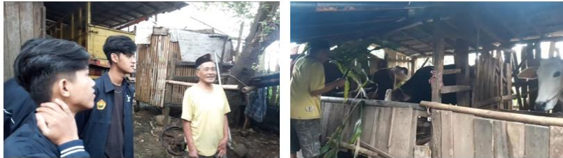
Gambar 1. Observasi di salah satu kandang sapi milik warga

selanjutnya didiskusikan bersama dengan perangkat desa dan pihak terkait untuk menentukan kesesuaian dan keberlanjutan pelaksanaan program kerja yang akan dijalankan.