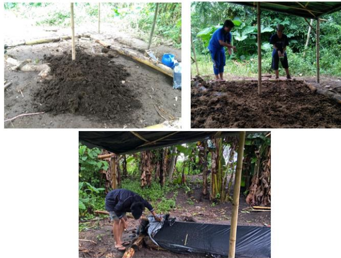
Gambar 2. Proses pembuatan pupuk kandang