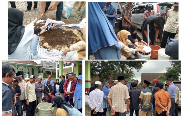
Gambar 6. Pelaksanaan praktik pembuatan pupuk organik

Setelah tahap penyuluhan/sosialisasi telah dilakukan, maka dilanjutkan dengan tahap praktik secara langsung prosedur pembuatan pupuk kandang dan Pupuk Organik Cair (POC). Demonstrasi dilakukan oleh narasumber bersama mahasiswa KKN yang dilaksanakan di halaman Balai Desa Gubrih. Selain itu, diberikan pula kesempatan bagi masyarakat yang hadir untuk menanyakan hal-hal terkait selama proses demonstrasi berlangsung. Masyarakat yang hadir sangat antusias dan terlibat aktif dalam kegiatan pelatihan ini.