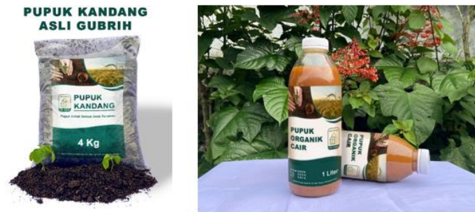
Gambar 7. Foto produk pupuk kandang dan POC