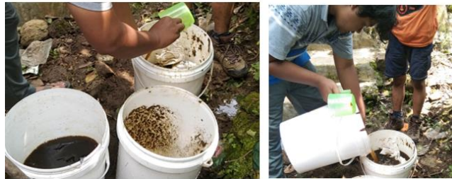
Gambar 4. Proses pembuatan POC