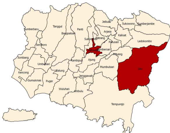
Gambar Peta risiko Hepatitis A di Kabupaten Jember tahun 2013

Hasil dari perhitungan kekuatan infeksi menunjukkan bahwa Kecamatan Silo (2916189,83) dan Kecamatan Kaliwates (2756391,45) mempunyai kekuatan infeksi yang lebih tinggi daripada daerah yang lainnya dan daerah yang memiliki kekuatan infeksi terendah adalah Kecamatan Semboro (1,07).