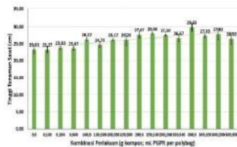
Gambar 2. Pengaruh Kombinasi Perlakuan Kompos dan PGPR terhadap Tinggi Tanaman sawi.

Berdasarkan hasil sidik ragam (Tabel 1) pemberian dosis kompos dan PGPR tidak terdapat interaksi. Pemberian kompos sebagai faktor tunggal berpengaruh sangat nyata terhadap tinggi tanaman. Sedangkan pemberian PGPR sebagai faktor tunggal berpengaruh tidak nyata terhadap tinggi tanaman.