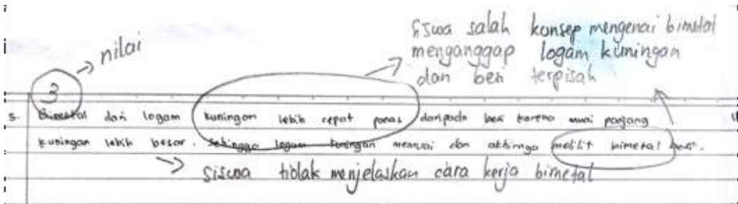
Gambar 1. Jawaban dari salah satu siswa kelas kontrol

lebih mengetahui keterkaitan antara keempat ranah dari pendekatan SETS ( Science, Environment, Technology, Society ). Dengan mengetahui keterkaitan empat ranah tersebut membuat siswa menjadi lebih mengerti aplikasi teknologi dari suatu materi pembelajaran khususnya materi kalor dalam kehidupan sehari-hari. Terbukti dari cara mereka menjawab soal post-test untuk aplikasi dari Science pada teknologi dan lingkungan, berikut salah satu contoh jawaban dari kedua kelas untuk pertanyaan “Jelaskan bagaimana bimetal bekerja pada setrika sebagai saklar panas! Jika bimetal tersebut terbuat dari logam kuningan dan besi dengan muai panjang kuningan lebih besar saat dipanaskan apa yang terjadi pada bimetal?”