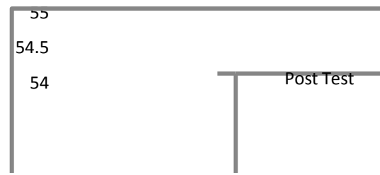
Gambar 4.1 Diagram perbedaan hasil post test kelas eksperimen dan kelas kontrol

Perbedaan hasil belajar fisika tersebut disajikan secara sederhana dalam gambar 4.1.