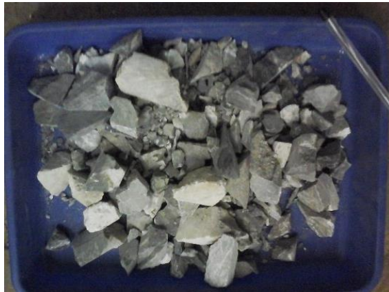
Gambar 2. Bijih setelah melalui proses crushing