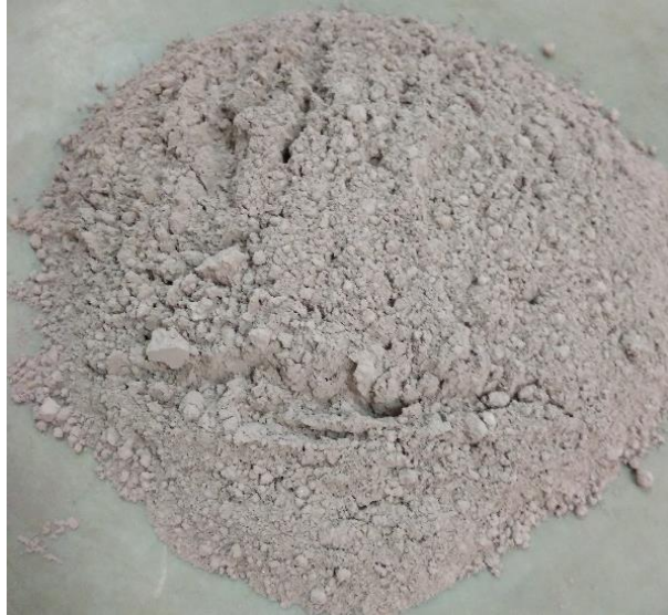
Gambar 4. Bijih setelah melalui proses grinding