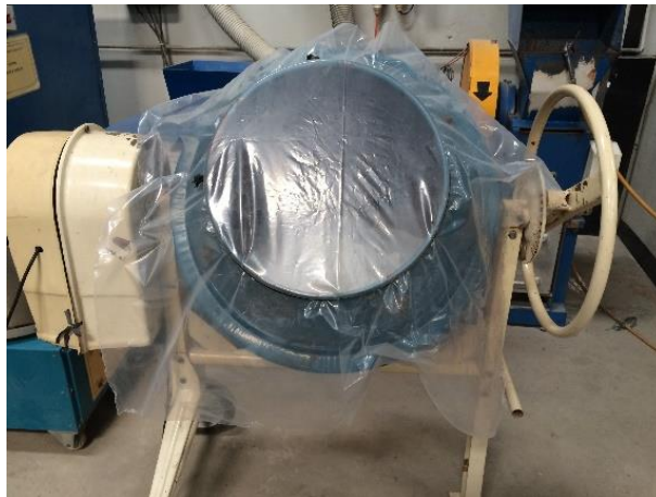
Gambar 5. Bijih setelah melalui proses blending

Hasil dari pencampuran berupa campuran yang homogen dan siap untuk dibagi menjadi beberapa contoh sampel yang akan digunakan untuk proses selanjutnya.