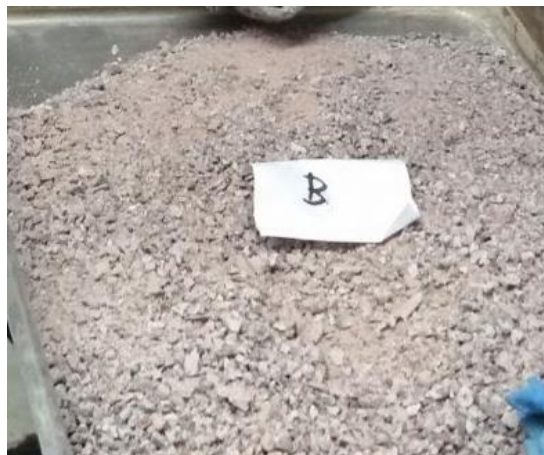
Gambar 3. Bijih setelah melalui proses secondary crushing