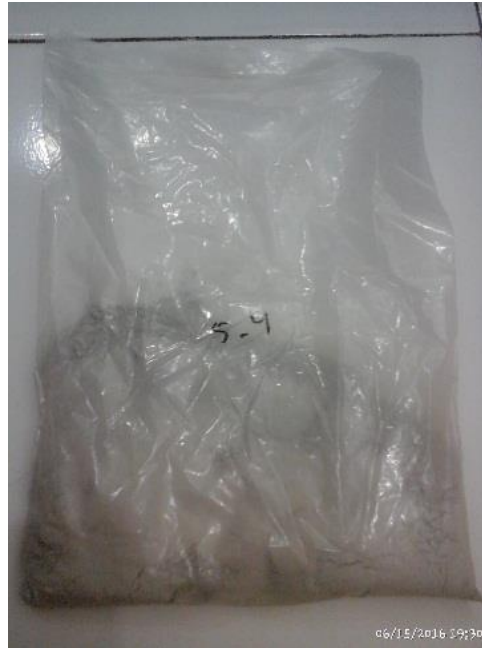
Gambar 6. Contoh paket sampel