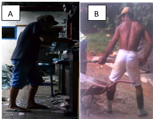
Gambar 1. (A). Posisi berdiri Responden, (B) Posisi berdiri pekerja di Brazil

Posisi berdiri pada pekerja plong merupakan sikap berdiri yang buruk, mengunci dan menempatkan panggul mereka ke depan, dan diikuti dengan pelengkungan tulang belakang yang berlebihan, yang meregangkan vertebra dan menimbulkan tekanan yang tidak diperlukan ke sendi-sendi panggul. Sikap berdiri seperti ini juga dapat menegangkan otot punggung bawah dan mengekibatkan otot punggung bawah tegang menyebabkan tekanan pada cakram punggung bawah dan memperburuk peredaran darah pada punggung bawah. Jika dibandingkan dengan pekerja dari Amerika posisi kaki dengan kuda-kuda yang lebih baik, dan posisi tulang belakang lurus dengan menggunakan engsel panggul sebagai tumpuan, sikap ini akan meringankan beban punggung dalam menahan gaya gravitasi. 1