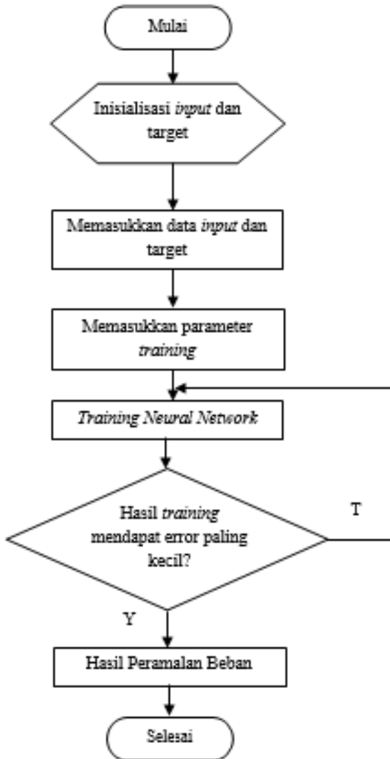
Gbr. 1 Flowchart Pelatihan Neural Network

dengan bulan Mei 2021 untuk melihat perbandingannya terhadap skenario yang digunakan sehingga didapatkan kesimpulan berupa nilai perbandingan antara beban nyata dengan hasil peramalan serta error dari sistem. Selain itu dilakukan pemberian saran yang dimaksudkan untuk memberi pertimbangan atas pengembangan penelitian selanjutnya