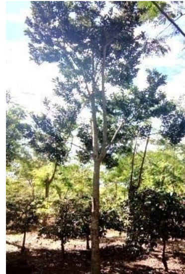
Gambar 1. Habitus Tanaman Makadamia ( Macadamia integrifolia )

Tanaman Makadamia merupakan tanaman tahunan dengan batang yang keras, tipe percabangan monopodial, ketinggian tanaman bisa mencapai 20 m (Gambar 1).