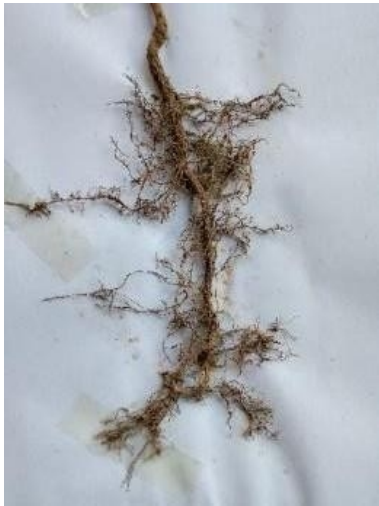
Gambar 2. Akar Bibit Makadamia ( Macadamia Integrifolia )