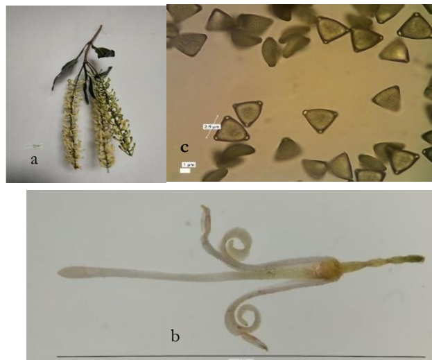
Gambar 5. Morfologi Bunga Makadamia ( Macadamia integrifolia ): a) Letak bunga Makadamia pada tangkai; b) Bagian benangsari bunga Makadamia dengan perbesaran 10x0,67 kali; c) Bentuk pollen bunga Makadamia dengan perbesaran 40x10 kali

Putik/alat kelamin betina pada bunga, khususnya pada bagian bakal buah/ ovarium , mengandung bakal biji/ ovule yang memiliki sel telur/ ovum . Sel telur yang setelah dibuahi oleh sel sperma yang ada dalam serbuk sari, akan berkembang menjadi embryo, dan bakal biji akan berkembang menjadi biji, sedangkan bakal buah akan berkembang menjadi buah. (Gambar 5).