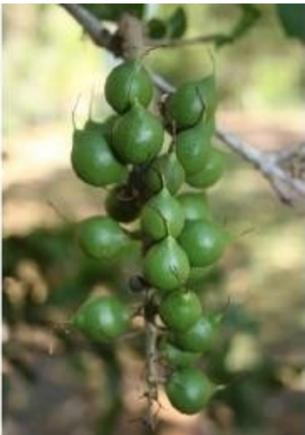
Gambar 6. Buah Makadamia ( Macadamia integrifolia )

Buah Makadamia berasal dari bakal buah, dalam satu buah terdiri dari satu biji, dan dinding buahnya tebal berdaging. Dinding buah terdiri tiga lapisan yaitu kulit luar ( epicarpium ), kulit tengah ( mesocarpium ), dan kulit dalam ( endocarpium ), sehingga buah makadamia termasuk buah sejati tunggal berdaging tipe drupe (Gambar 6 dan 7).