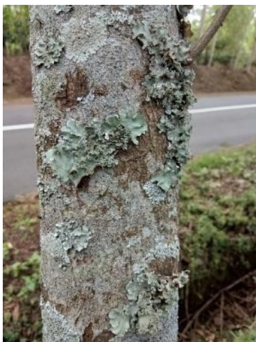
Gambar 3. Batang Makadamia ( Macadamia integrifolia )

Makadamia ( Macadamia integrifolia ) merupakan tanaman tahunan dengan batang yang keras berkayu (lignosus). Tanaman Makadamia, memiliki batang yang pada bagian bawahnya lebih besar dan ke ujung semakin mengecil. Permukaan dari batang tanaman Makadamia ini beralur ( sulcatus ) yaitu terdapat alur-alur yang jelas pada arah membujur, serta memiliki arah tumbuh batang yang tegak lurus yaitu arah tumbuhnya adalah tegak lurus ke atas. Percabangan pada tanaman Makadamia termasuk pada percabangan monopodial yaitu batang pokok selalu tampak jelas karena lebih besar dan Panjang dibanding cabang-cabang pohon (Gambar 3).