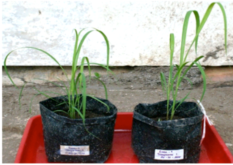
Gambar 3. Aklimatisasi tanaman putatif transforman pada media tanah

Tanaman putatif transforman yang berumur \pm 1 bulan (Gambar 3.) diambil bagian daunnya untuk dilakukan isolasi DNA genom untuk dianalisis.