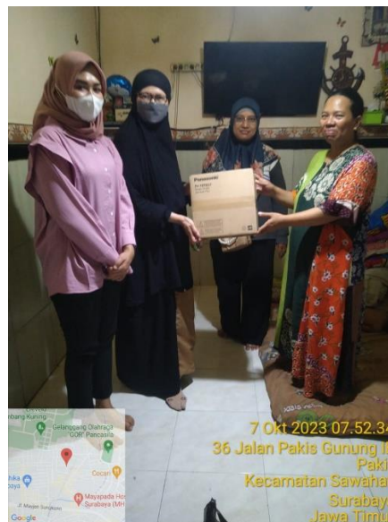
Gambar 4. Pemberian Exhaust Van Pada Salah Satu Ibu Balita

stunting pada anak usia 24-36 bulan. Anak-anak pada rentang usia tersebut yang memiliki riwayat penyakit infeksi memiliki risiko 4,2 kali lebih tinggi dibandingkan dengan balita yang jarang mengalami penyakit infeksi. (8).