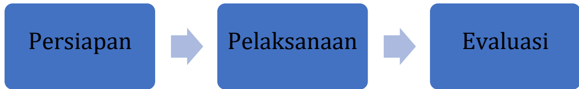
Gambar 1. Alur Kegiatan Pengabdian Kepada Masyarakat

Pada tahap persiapan untuk pelaksanaan pengabdian kepada masyarakat, langkah-langkah mencakup proses perolehan izin dari pihak mal pelayanan publik di Kota Surabaya, berkoordinasi dengan mitra kerja seperti Kelurahan Pakis dan Puskesmas Pakis. Selain itu, dilakukan penyusunan berbagai media edukasi seperti leaflet, poster, buku saku, serta materi penyuluhan. Selain itu, juga disiapkan alat evaluasi berupa pre-test dan post-test sebagai bagian dari persiapan pengabdian ini.