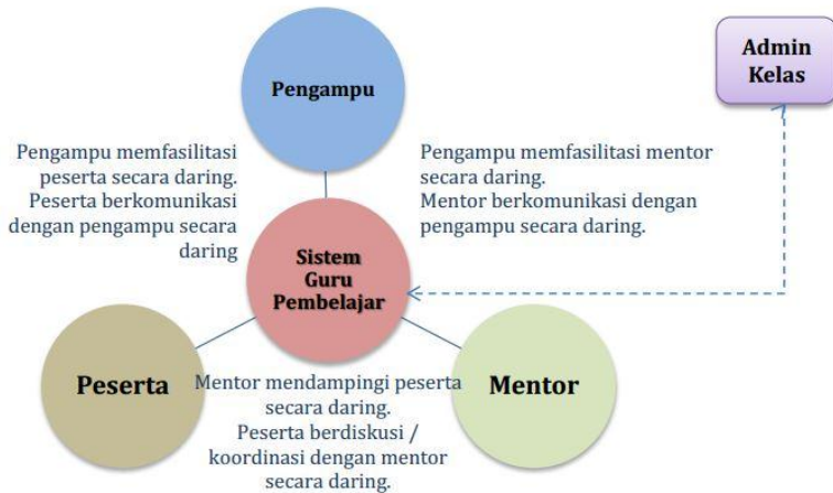
Gambar 2. Model pembimbingan Guru Pembelajar moda daring - Model 2

Guru Pembelajar moda daring yang dikembangkan oleh Ditjen GTK harus memenuhi prinsip sebagai berikut: